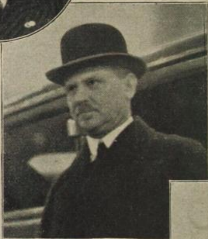
Dr.-Ing. h. c. Maybach (Maybach)