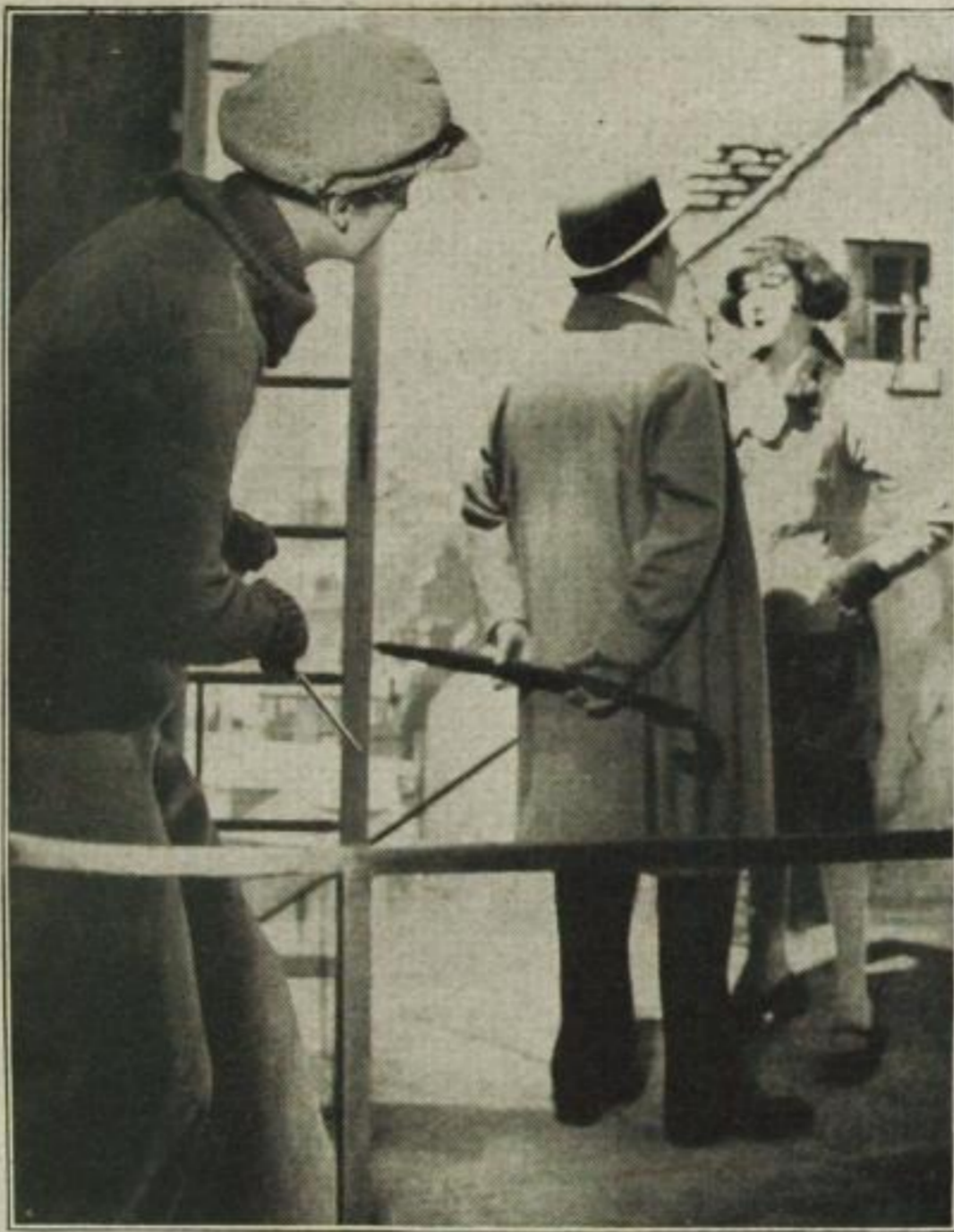
Das Opfer in der Falle

Diese psychologische Erscheinung haben sich geschäftstüchtige und unbestreitbar menschenkende Unternehmer zunutze gemacht, indem sie besonders bei dem Strom der Reisenden mit Recht ein gesteigertes Bedürfnis nach starkem Erleben voraussetzten und zu „Führungen durch die Unterwelt“ riefen. In Paris war es anfangs wirklich unverfälschtes, echtes Kaschemmenleben, das man den Fremden zeigte, und aus dem Spaß wurde nicht selten Ernst, wenn ein Fremdling die Sache zu harmlos nahm und seine Unerschrockenheit zeigen wollte. Mit der Zeit aber waren es schließlich mehr Fremde, vor allem Amerikaner und Briten, als Diebe und Zuhälter, die in dunklen Nächten unter den