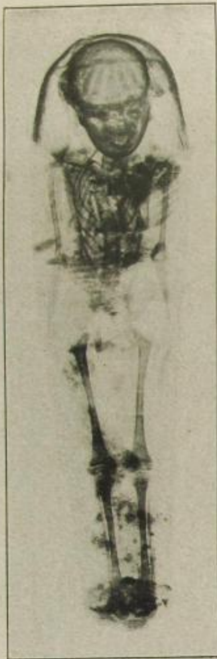
Röntgenaufnahme einer Kindermumie (die Schwester des Knaben auf nebenstehendem Bilde). Auch hier ist eine Verkrümmung des Rückgrats deutlich sichtbar.