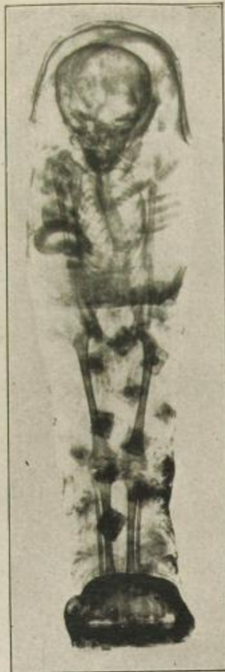
Röntgenaufnahme einer Kindermumie (Knabe); sie zeigt deutlich eine starke Verkrümmung der Wirbelsäule, die wohl auf schlechte Haltung beim Sitzen zurückzuführen ist.