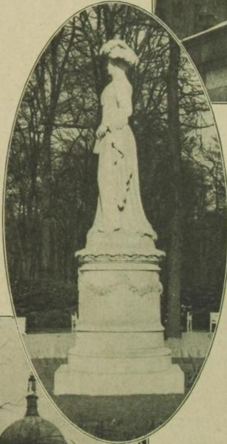
Unten: Kleine Kopie vor dem Schloßchen Charlottenhof in Potsdam