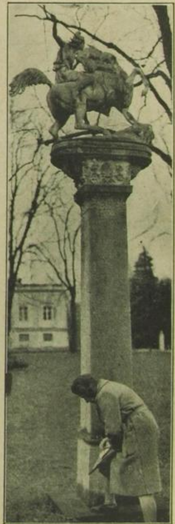
Links: Kopie in Potsdam vor dem Neuen Palais