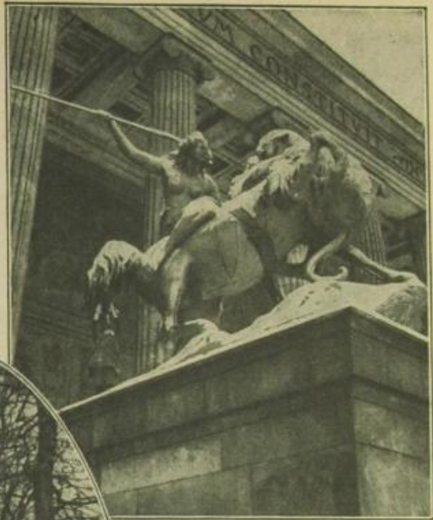
Amazone von Kiss vor dem Alten Museum

Unter den Linden ging's los. Das Denkmal des Großen Kurfürsten wurde langsam im Bogen umfahren. Mister Babbit hat Interesse für Männer, denen man ein Denkmal setzt. Ganz genau sieht er sich das Standbild an und denkt, dieser Schlüter, der das Denkmal gemacht hat, könnte vielleicht auch einmal nach Amerika kommen, dort wird er doch sicher besser bezahlt. Dieses Standbild des Großen Kurfürsten ist