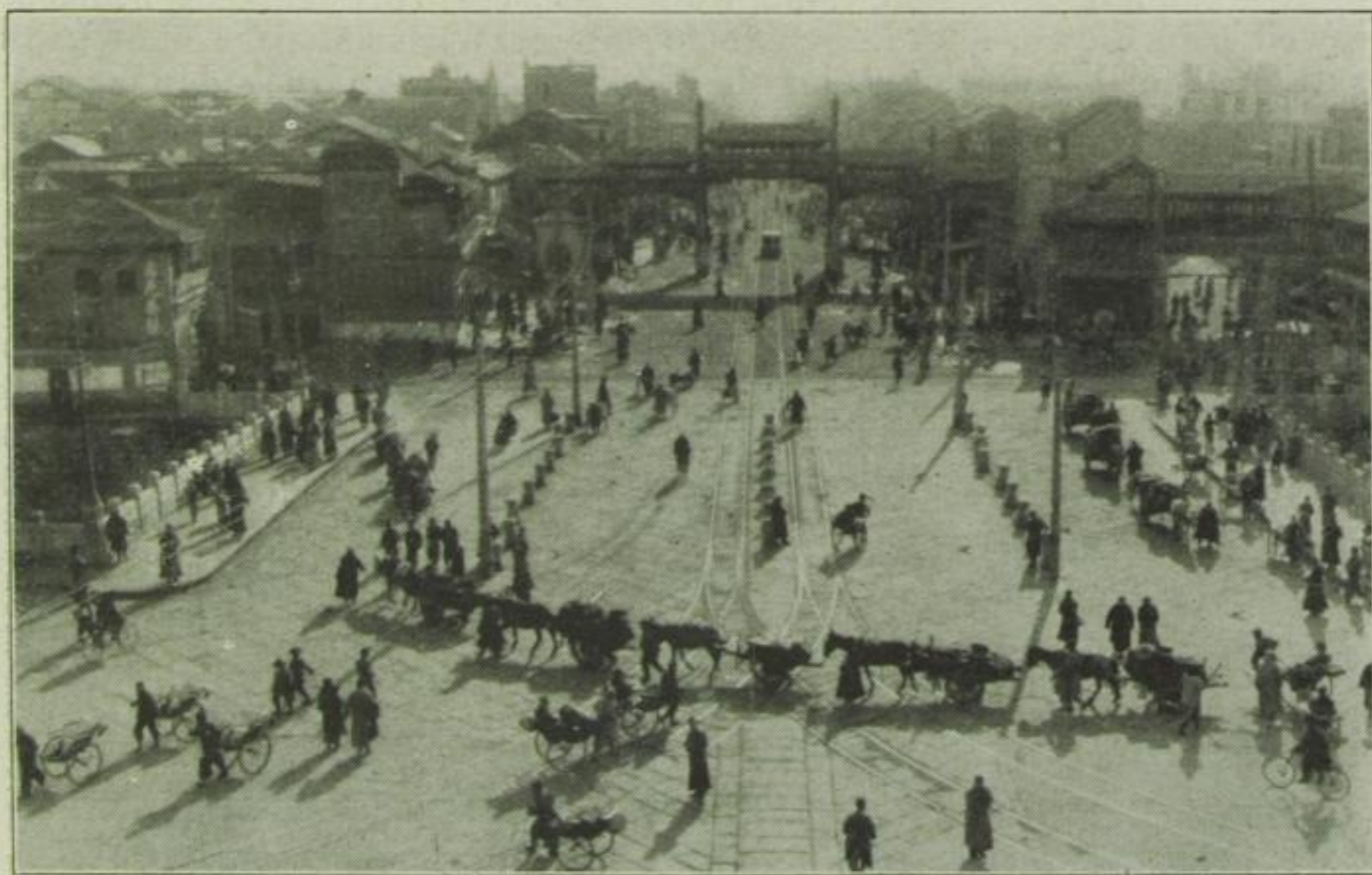
Der „Potsdamer Platz“ von Peking

Aufnahmen aus dem Gustav von Estorff-Film „Die Welt der gelben Rasse“