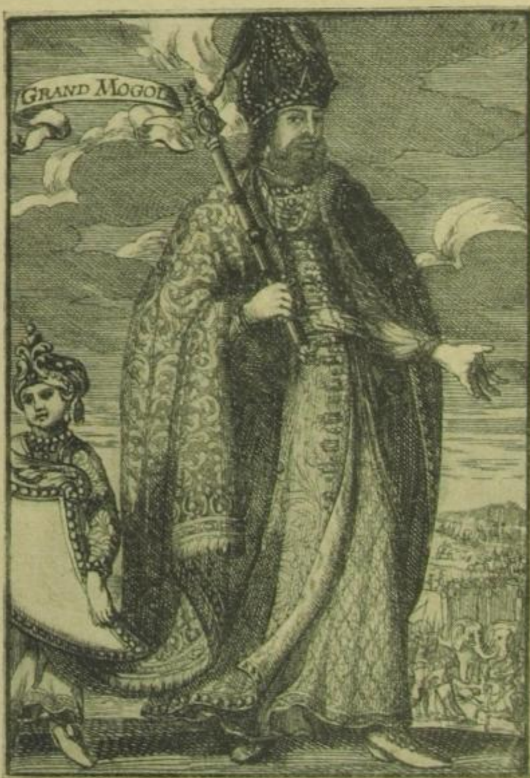
Der Großmogul der erste rechtmäßige Besitzer des berühmten blauen Diamanten

Es lebte im 17. Jahrhundert ein französischer Abenteurer, genannt Jean Joseph Tavernier, der als ein berühmter Reisender und Kenner von Edelsteinen galt. Er liebte zu reisen wegen der Abenteuer selbst, die sich ihm darboten, noch mehr aber der Schätze halber, die er verstand, mit guten Worten oder mit Gewalt zu erwerben. Zu Hause in Frankreich war er längst zu einem Hofdignitar geworden, der die Edelsteine des Königs überwachte und dafür ein ansehnliches Jahresgehalt genoß. Dieses Jahresgehalt vermochte ihn jedoch nicht zu fesseln, und obwohl er schon nahe den Achtzigern war, verließ er den Hof, um abermals auf Abenteuer auszugehen.