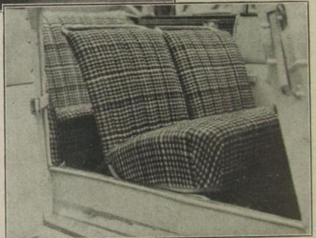
Besonders praktische „Stahlsitze“ beim DKW „Sonder- klasse“, die mit handgewebtem Stoff überzogen sind. Die zweckmäßige Innenausstattung entstand in der Fabrik der Gebr. Happich in Elberfeld.

Auch die übrigen, neuein- geschlagenen Wege dienen zu 80 % der Vervollkommnung der Kleinwagen. So der schwim- mende Motor, oder, anders ge- sagt, die schwebende Motorauf- hängung, die einfach darin be- steht, daß der Motor, um von dem Fahrgestell Erschütterungen fernzuhalten, in Gummi ein- gebettet wird; so der starre oder Kastenrahmen, der die Win- dungsfreiheit des Rahmens da- durch zu erreichen versucht, daß