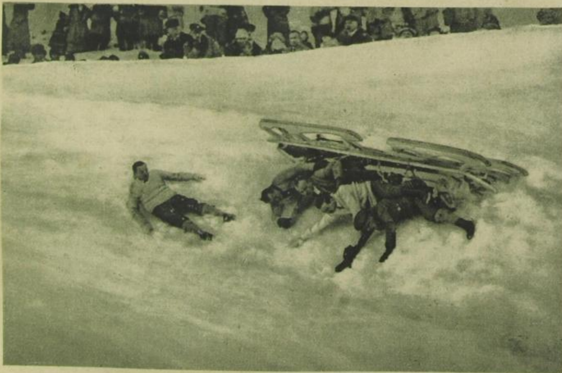
1 Sekunde später: Beim Versuch die Maschine herumzureißen, überschlägt sich der Bob. Obwohl der Sturz recht gefährlich aussieht, wurde niemand verletzt.