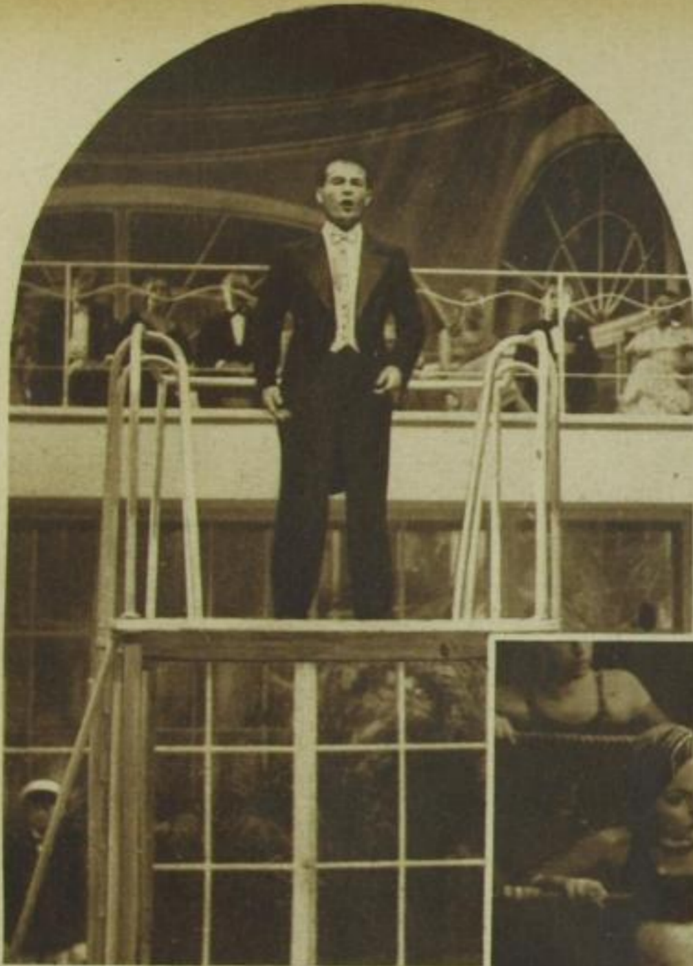
Jan Kiepura singt in dem neuen Joe May-Film der Ufa im Wellenbad