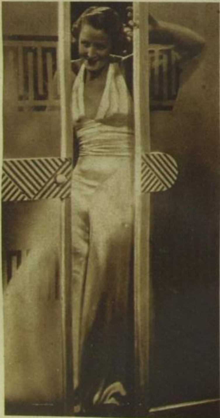
Brigitte Helm im Joe May-Film „Hochzeitsreise zu Dritt“