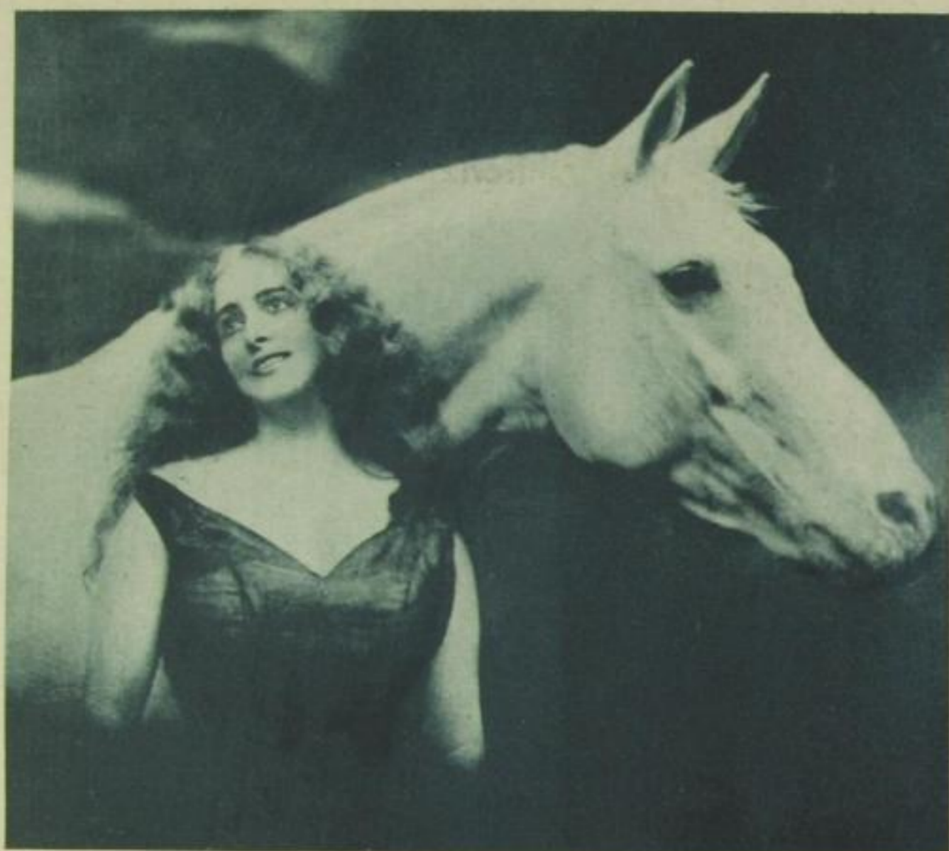
Henny Porten als Lady Godiva