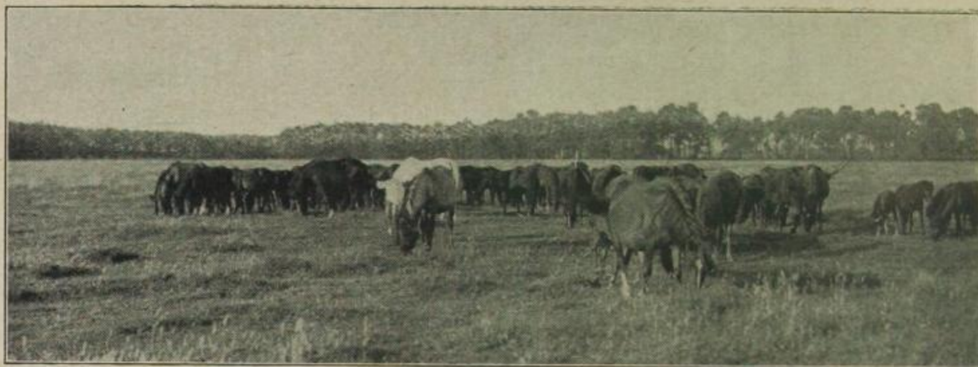
Die Merfelder Wildpferde grasen friedlich in der Heide