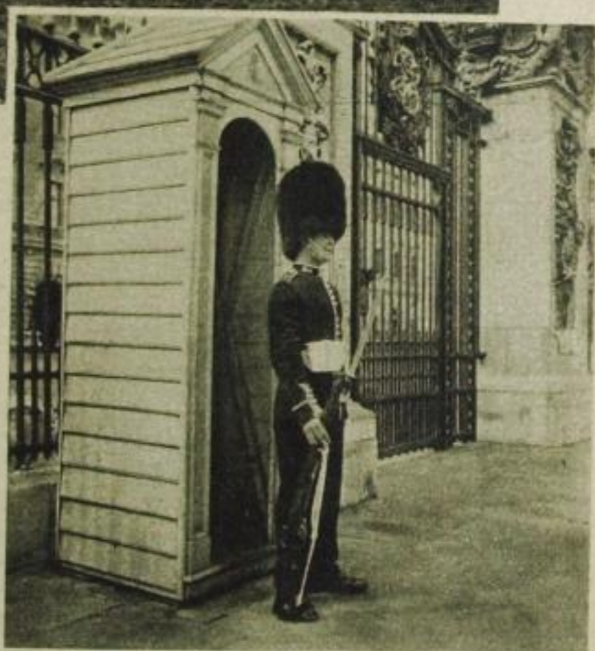
Der Posten vor dem Buckingham-Palast

den König, wenn er das Parlament eröffnet, stehen Wache vor seinen vielen Palästen, spielen Potpourris zur Unterhaltung königlicher Gäste bei Bällen oder Garden Parties im Buckinghamschlosse, ergötzen das (hauptsächlich ausländische) Publikum, wenn sie zweimal am Tage, zu Fuß oder zu Pferde, am White Hall Wache wechseln und dabei mit einer Fülle an Traditionen, silbernen Panzern und weißen Lederhosen alle Blicke zu verführen suchen. Im Grunde jedoch denken sie weniger an das graue Klima oder den König als vielmehr an sich selbst. Ihre Selbstliebe mag verständlich erscheinen, wenn man hinzufügt, daß keiner von ihnen weniger als 6 Fuß mißt, zu einem sehr nonchalanten Gang erzogen ward, ein kokettes Stöckchen in der