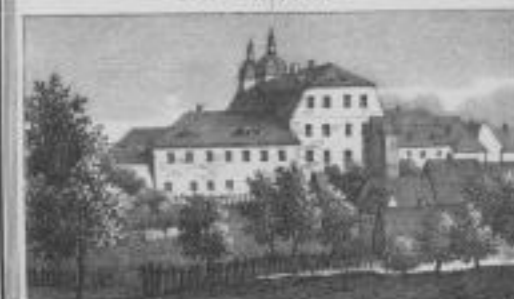
Die Knaben u. Mädchen Schule.