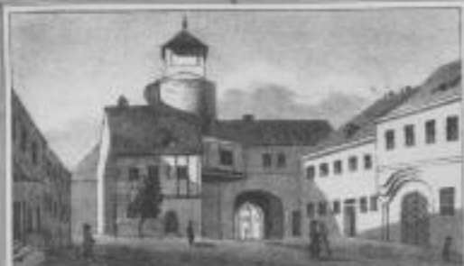
Das Eulenburger Chor.