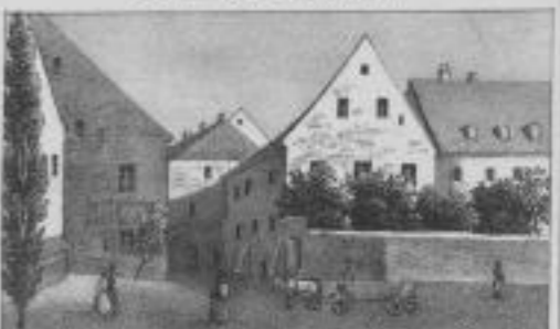
Die beiden Diaconaten.