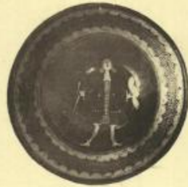
2. Bemalte Thonteller aus dem Museum für sächsische Volkskunde