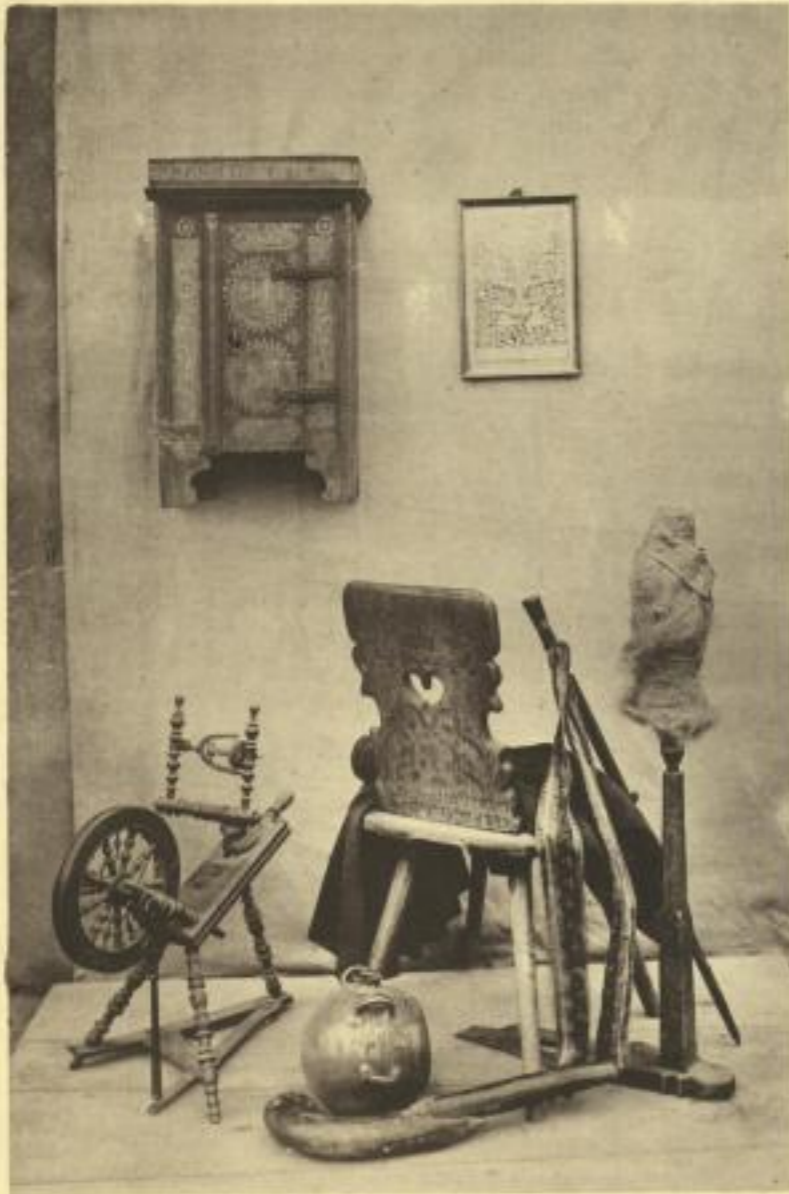
1. Hausgeräthe aus dem wendischen Volksmuseum