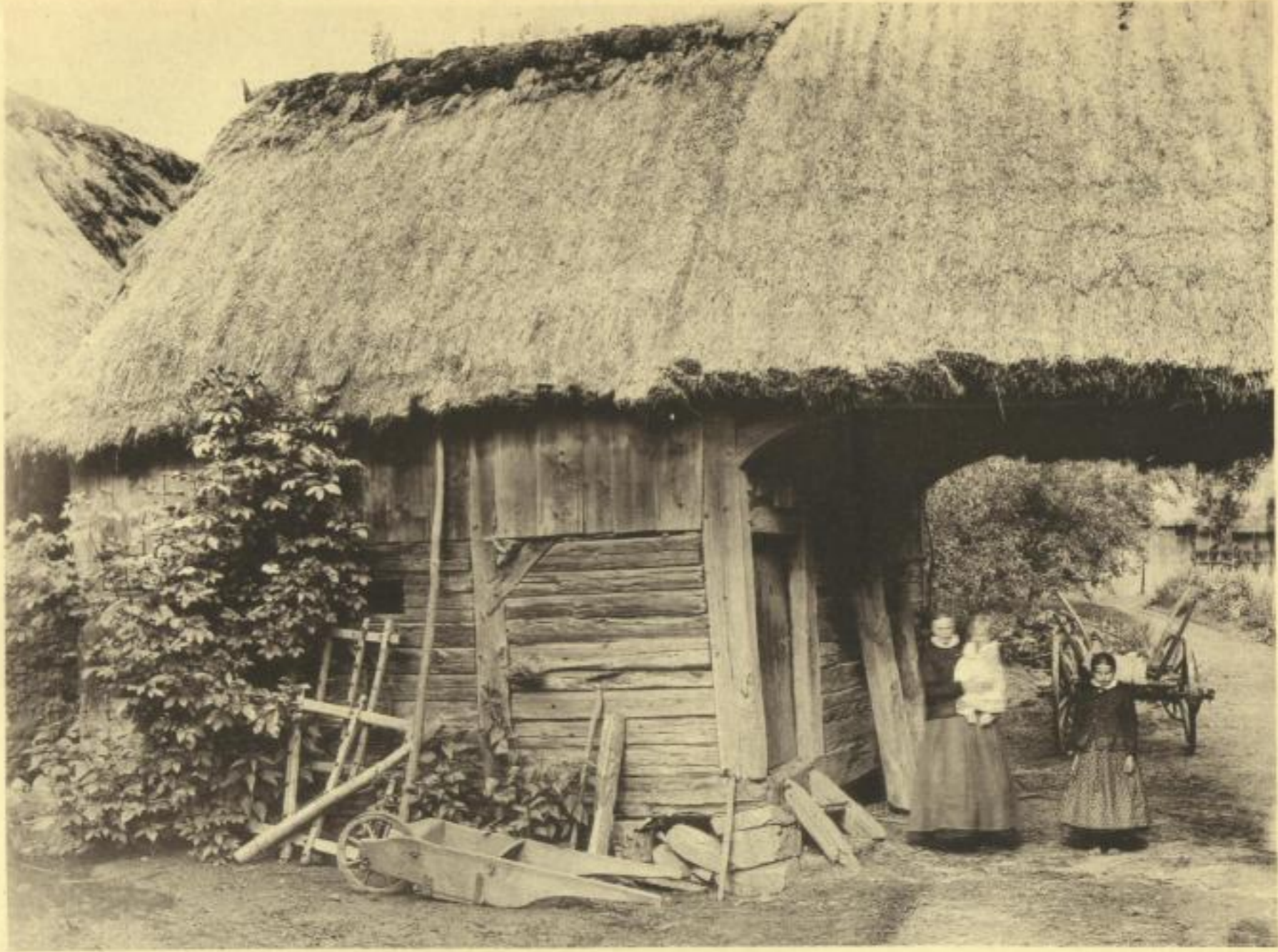
Wendischer Durchfahrtschuppen aus Kotten (Ober-Lausitz)