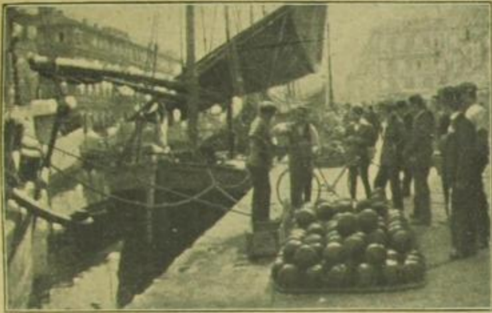
An der blauen Adria: Canal grande in Triest

bei an den Königsgräbern und Pyramiden, um die die Magie der Jahrtausende geistert. Cook & Son führen uns in das Sandmeer der flimmernden Wüste. Durch das kochende Rote Meer erreichen wir die Koralleninsel Mombassa, und nun wechseln täglich die unerhörten Überraschungen dieser Reise, die mehr ist als Schwelgen in Schönheit: wertvollstes Studium.