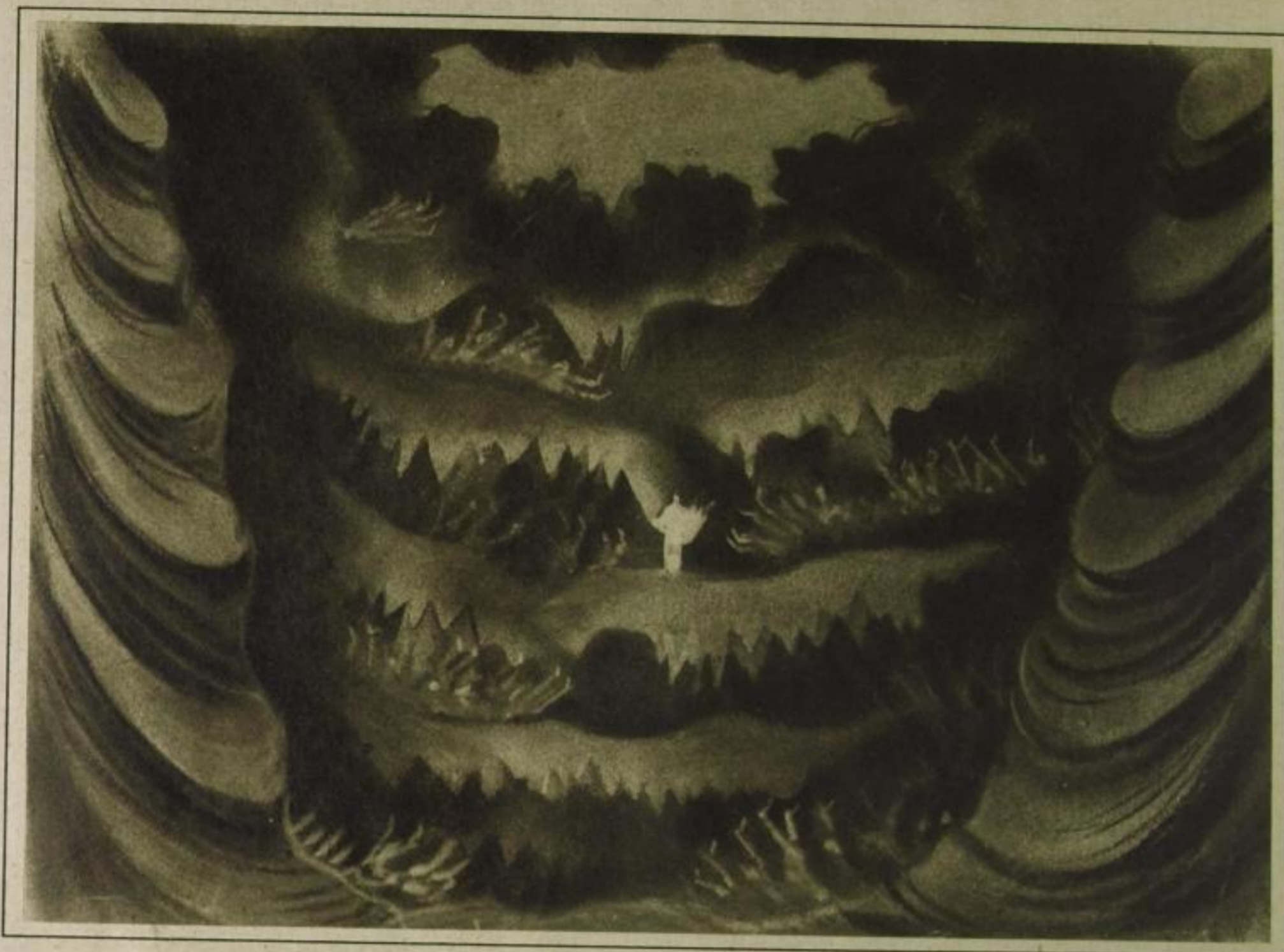
Einheit der bewegten Szenerie mit der Musik: Die Unterwelt in Glucks „Orpheus“ von César Klein