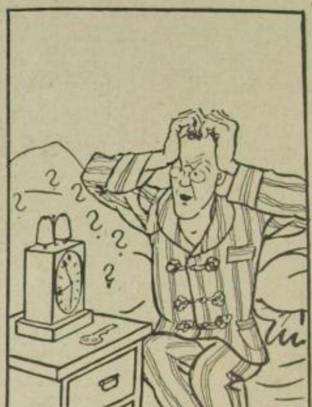
Nanu? Verflucht und zugenäht! Das Biest bleibt still! Was? Schon so spät?