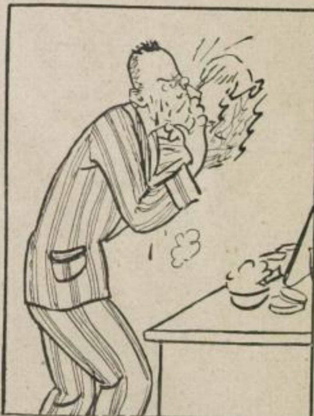
Es drängt die Zeit! -- die Hand erzittert und schon fließt Blut --