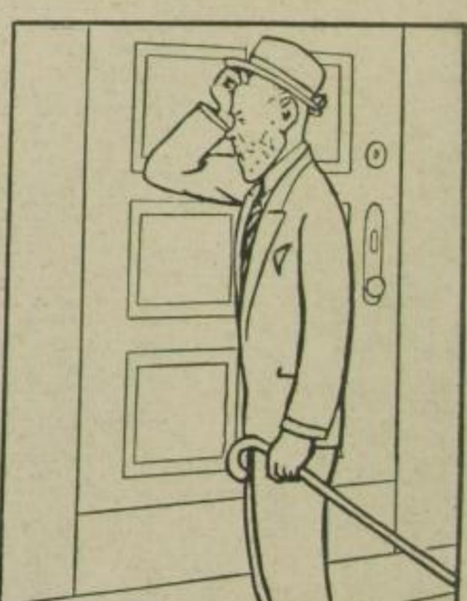
Verdammt! Wo blieb die Aktentasche!