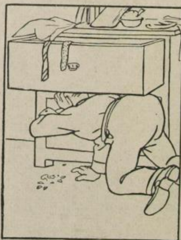
Der Kneifer klirrt! Es dröhnt der Kopf.