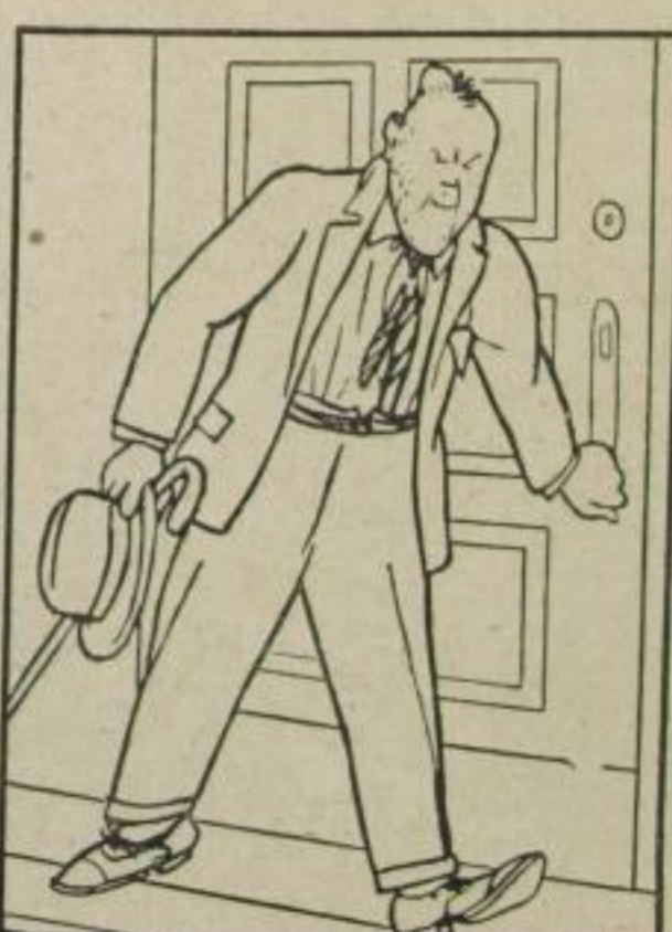
Na flugs ins Auto jetzt, ins rasche --