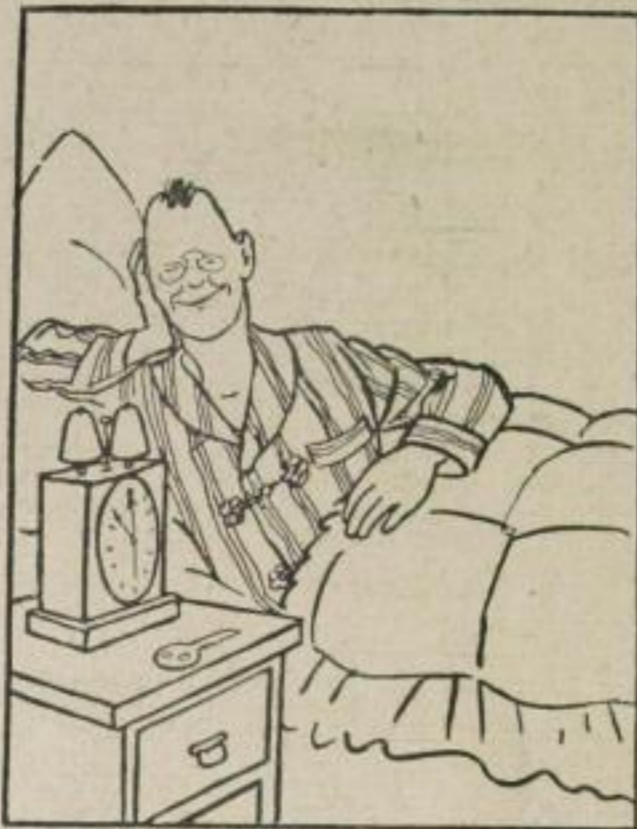
Wie kann man schlafen ohne Sorgen so „eingeweckt“ . . .