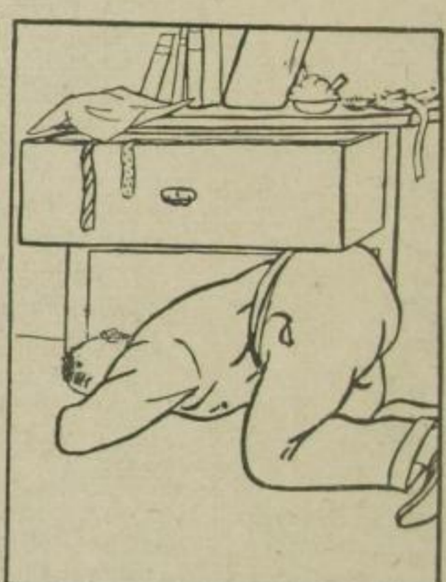
. . . der Kragenknopf!!