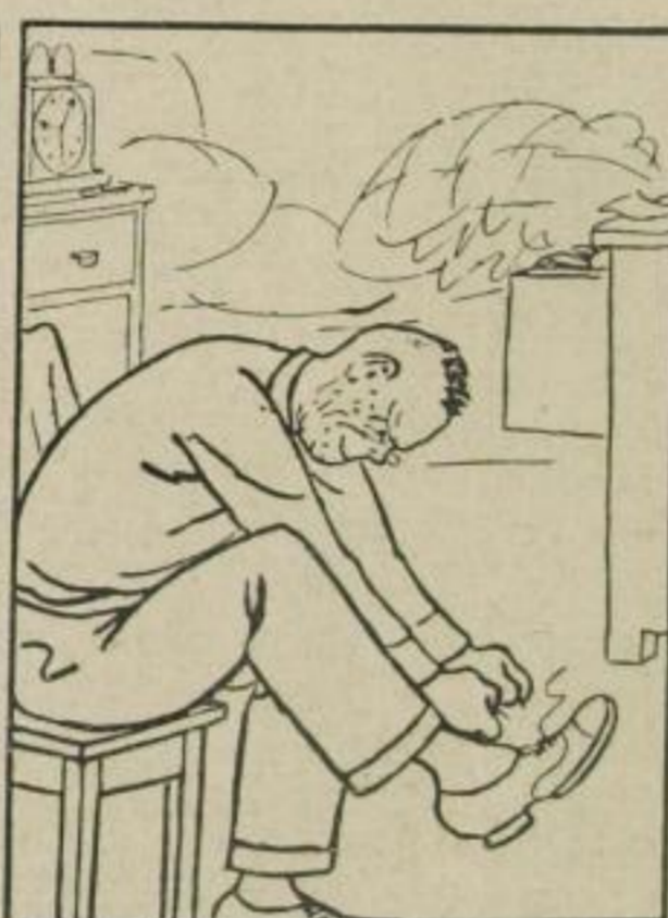
man ist erbittert. Das Schuhband futsch! . . .