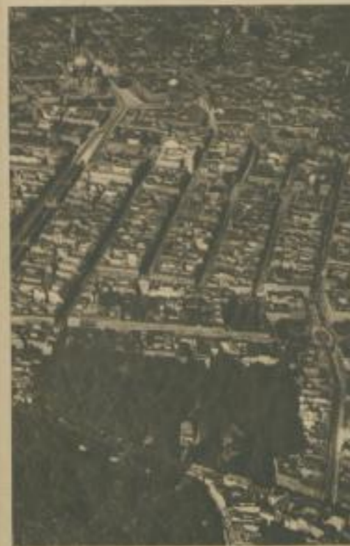
Das Blickfeld weitet sich: Flughafen Berlin. Im Hintergrund das Häusermeer

Dörfer an ihnen. So lauten Straßen ängstlich auseinander in die Weite; so suchen sie sich zu den Orten der Menschen. So geben die Ströme zum Meer. So ist die Führung der Eisenbahnen und der Kanäle. So reißt der Mensch mit Fabrikanlagen und Holzplätzen und Rodungen der Erde Wunden. So heilt er sie mit Gärten, Ackern, Dörfern.