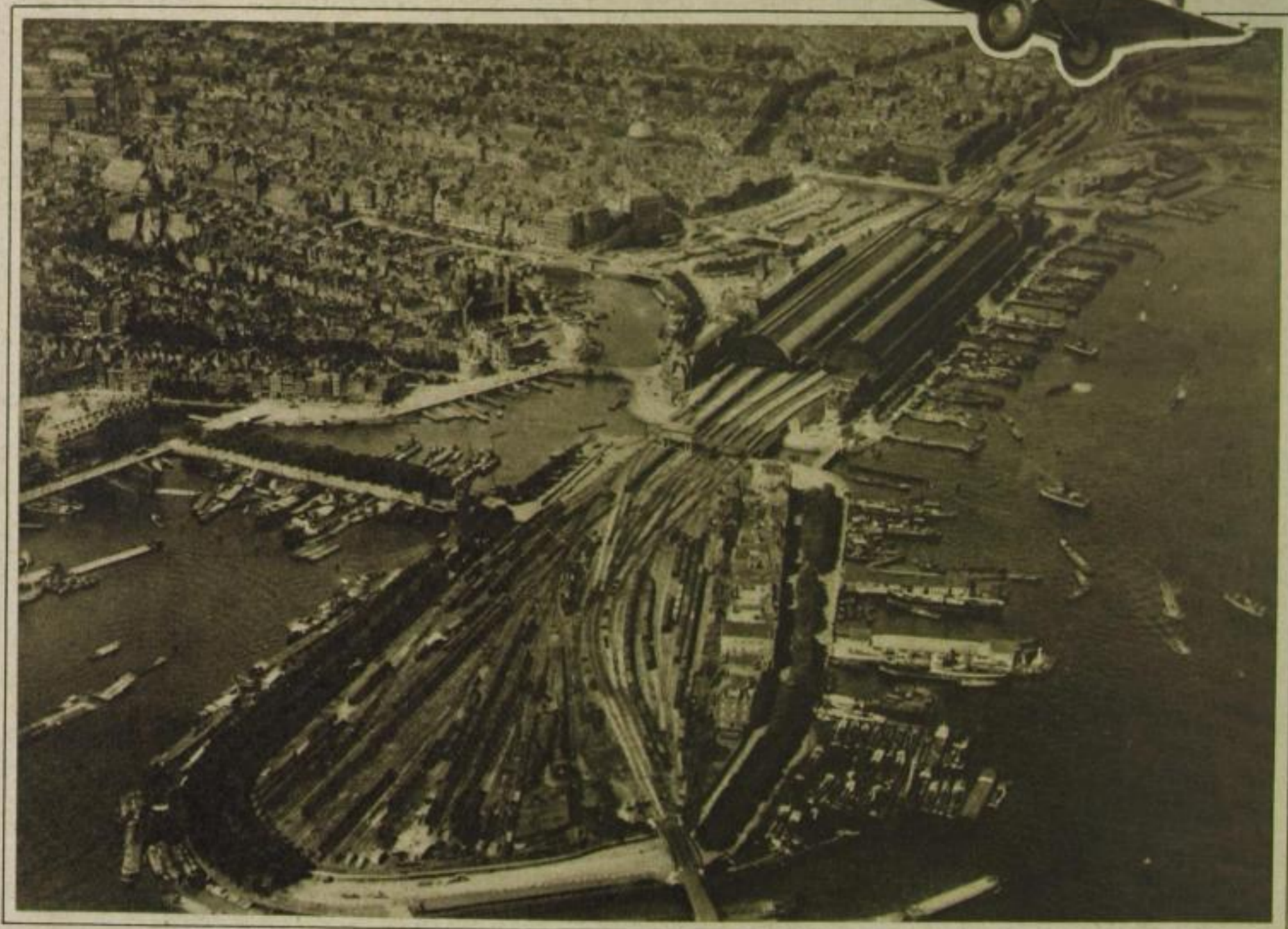
„Sdion tut das Meer sich mit erwärmten Buchten vor den erstaunten Augen auf“ Amsterdam, Zentralbahnhof