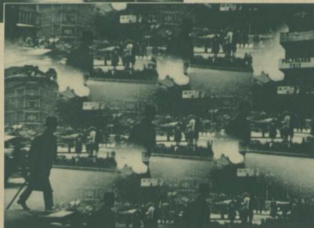
Im Brennpunkt großstädtischen Lebens