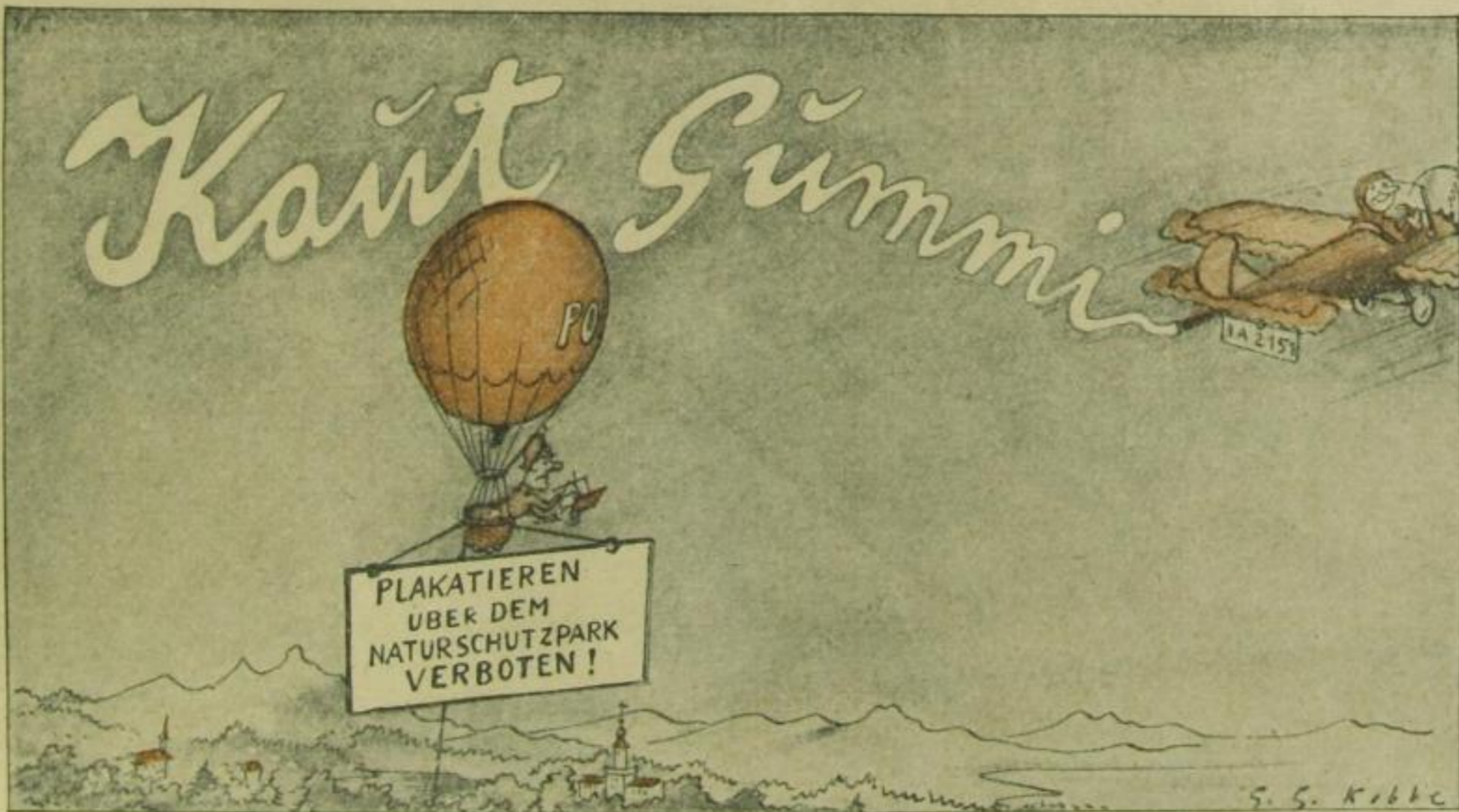
Strafmandate in schwindelnder Höhe

Alles an Bord! Stopp fünf Minuten bei den Kanaren: „Luftomnibusse nach Teneriff, Palmas, Madeira . . .