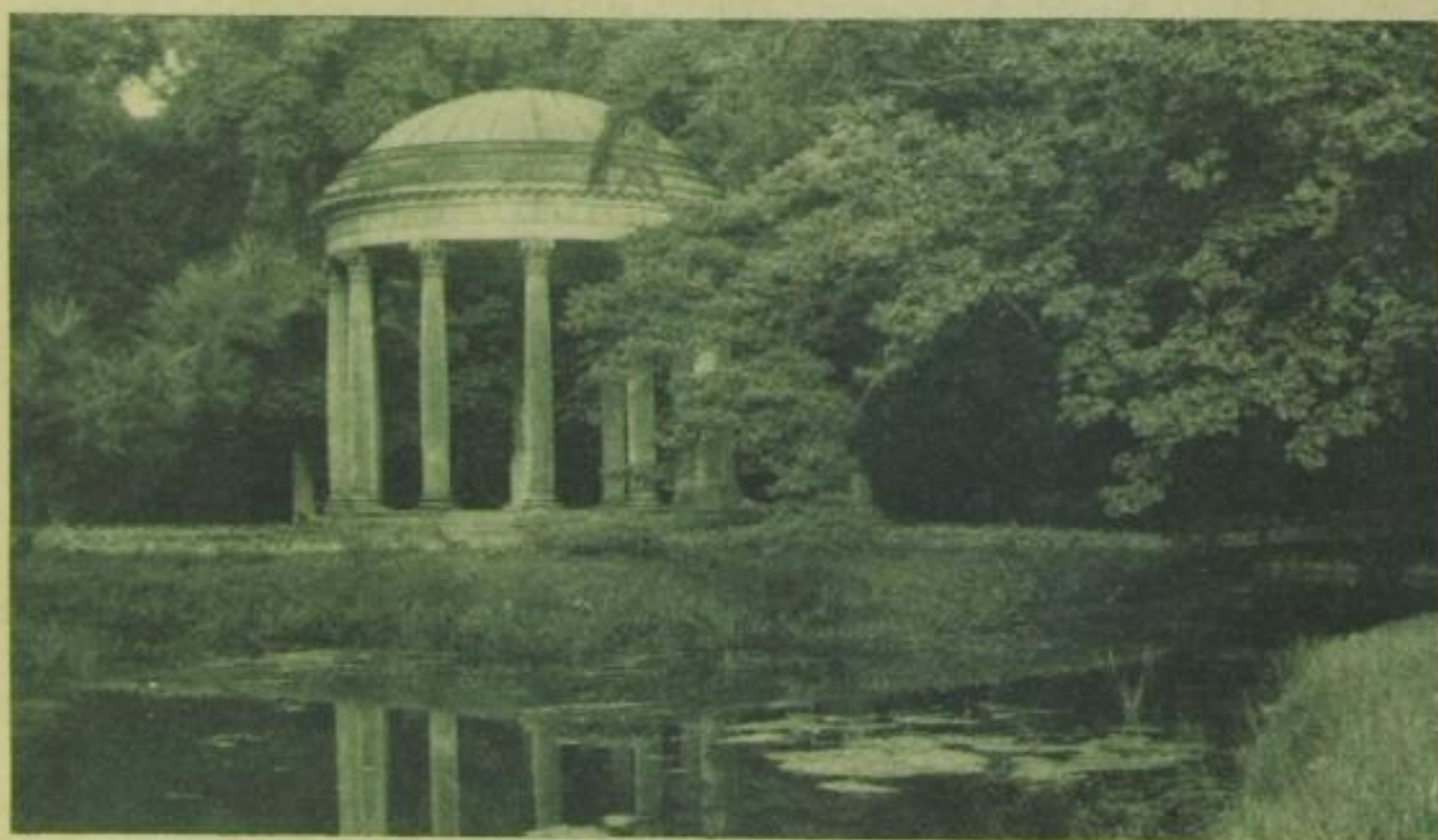
Temple de l'Amour im Park von Petit-Trianon