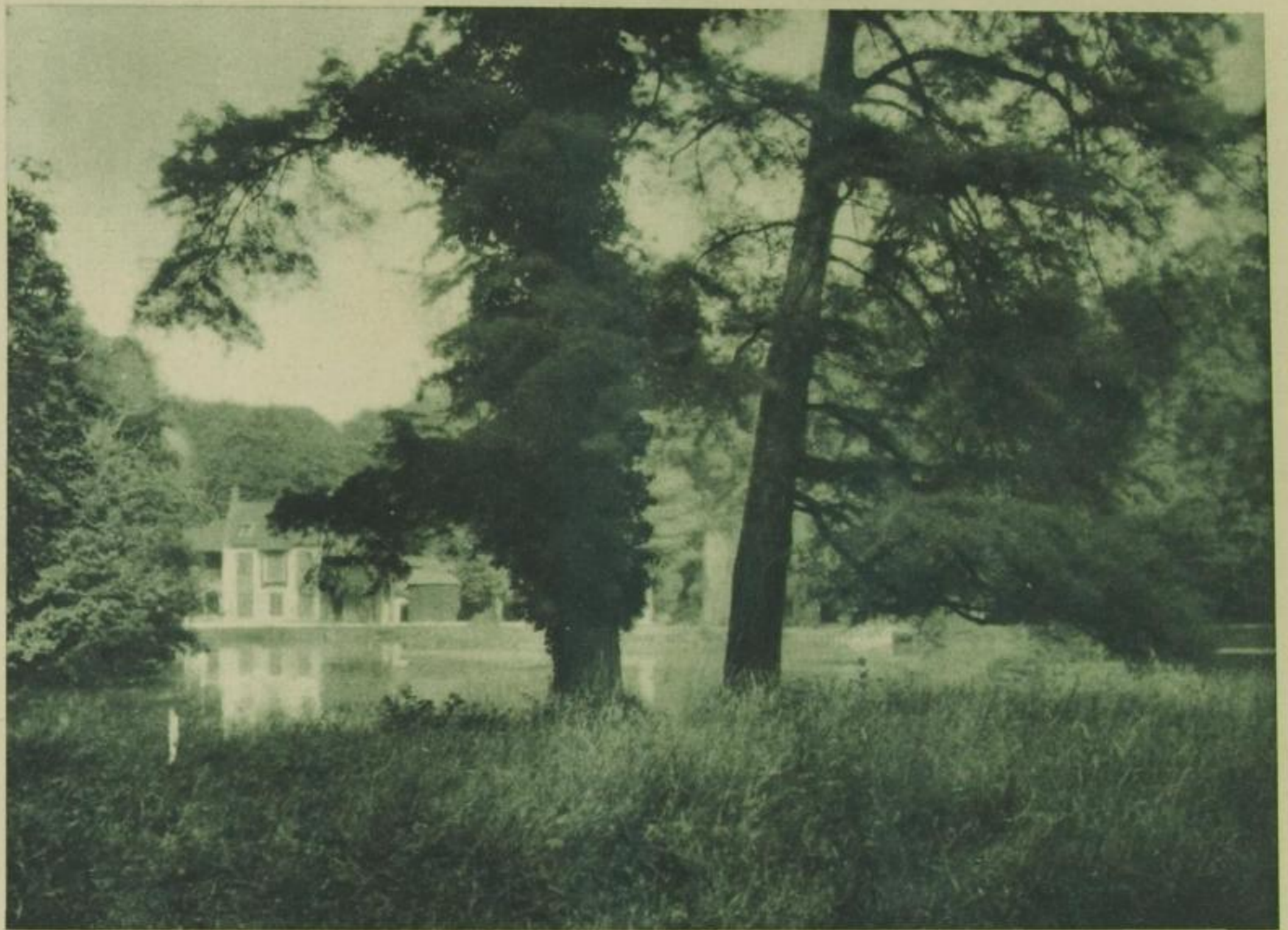
„Rückkehr zur Natur“: Der Hameau im Garten von Petit-Trianon. 1782-86 erbaute Bauernhäuschen für die Damen des Hofes