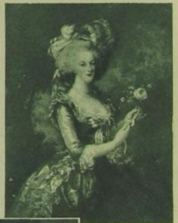
Königin Marie Antoinette Nach dem Gemälde von Mme. Vigée-Lebrun