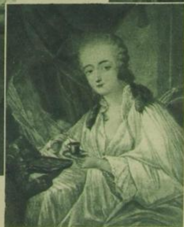
Gräfin Dubarry, letzte Geliebte Ludwigs XV. Nach dem Gemälde von Dagoty