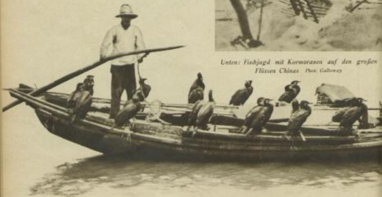
Unten: Fischjagd mit Kormoranen auf den großen Flüssen Chinas