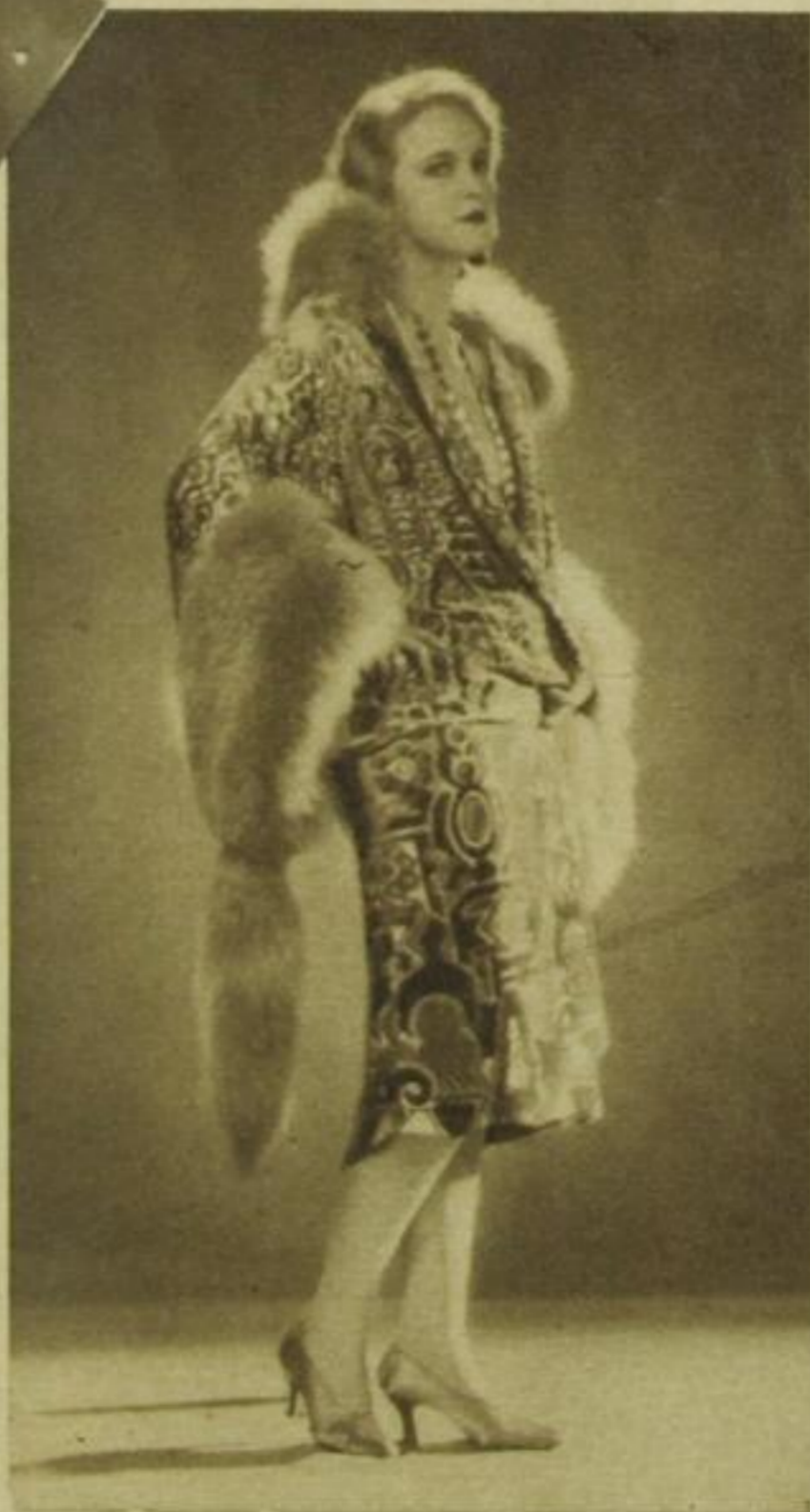
Camilla Horn in einem Mantel aus bemaltem Samt mit Stadefuchsbesatz, Modell: Max Becker

Die schweren Stoffe der Re- naissanceepoche und der Zeit der großen französischen Kriege würden