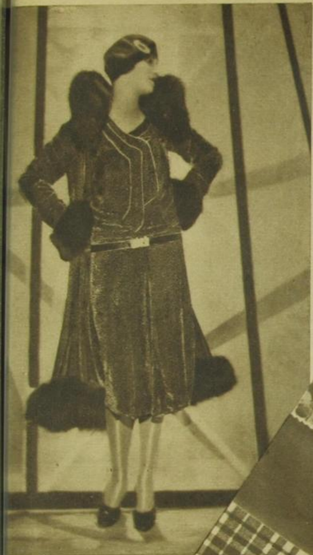
Herbstensemble aus schwarzem rot bedruckten Samt mit Fuchs- satz, Modell: Jean Patou