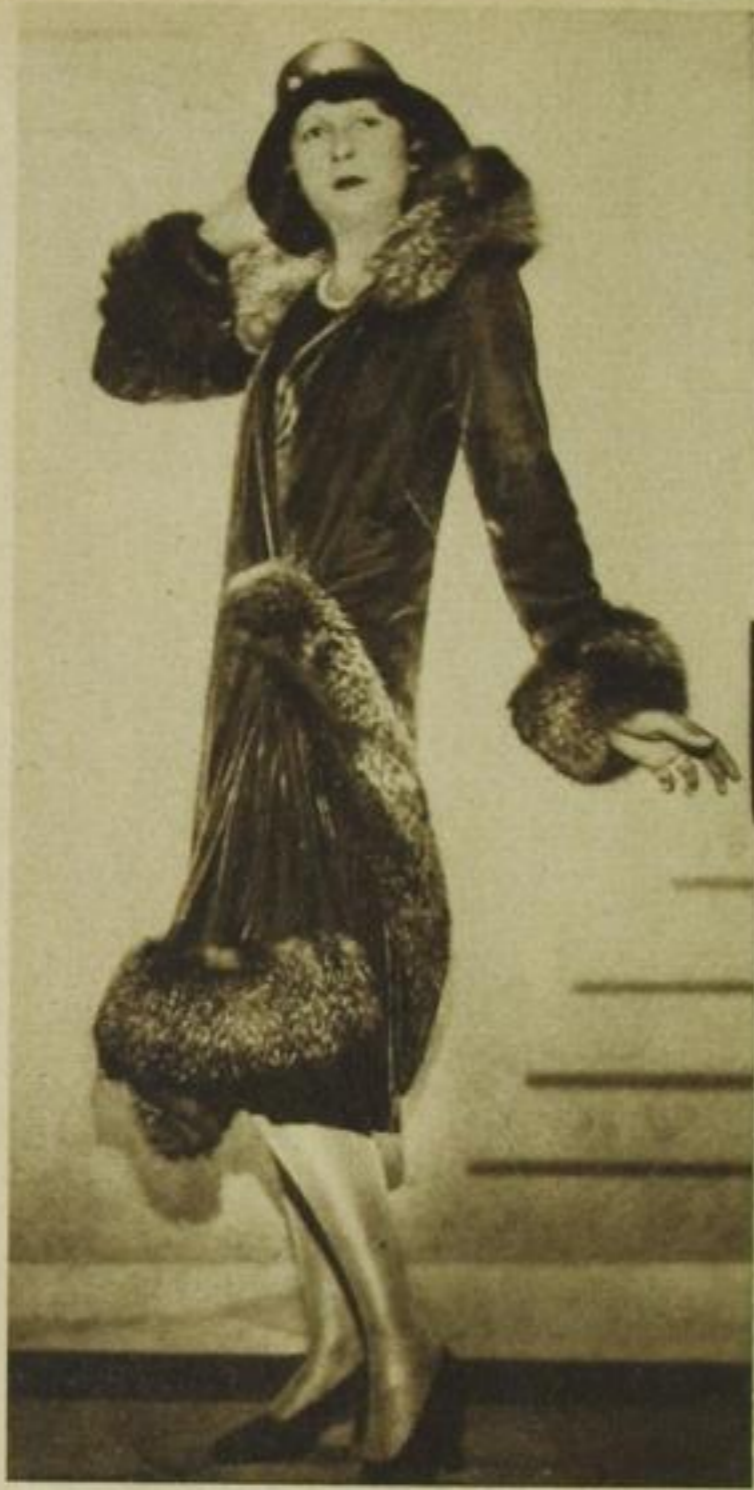
Herbstmantel aus Lindener Samt mit Silberfuchsbesatz, Modell: Jean Patou