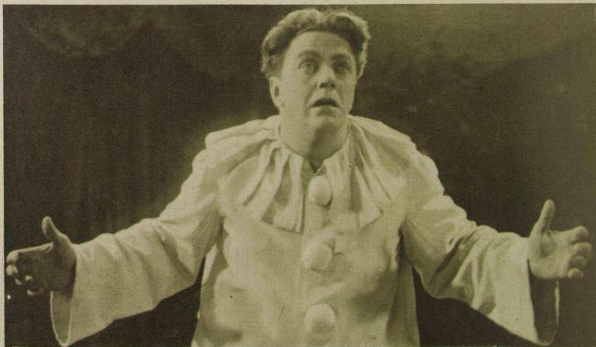
Kammersänger Tino Pattiera singt aus „Bajazzo“ für den Lignose-Hörfilm