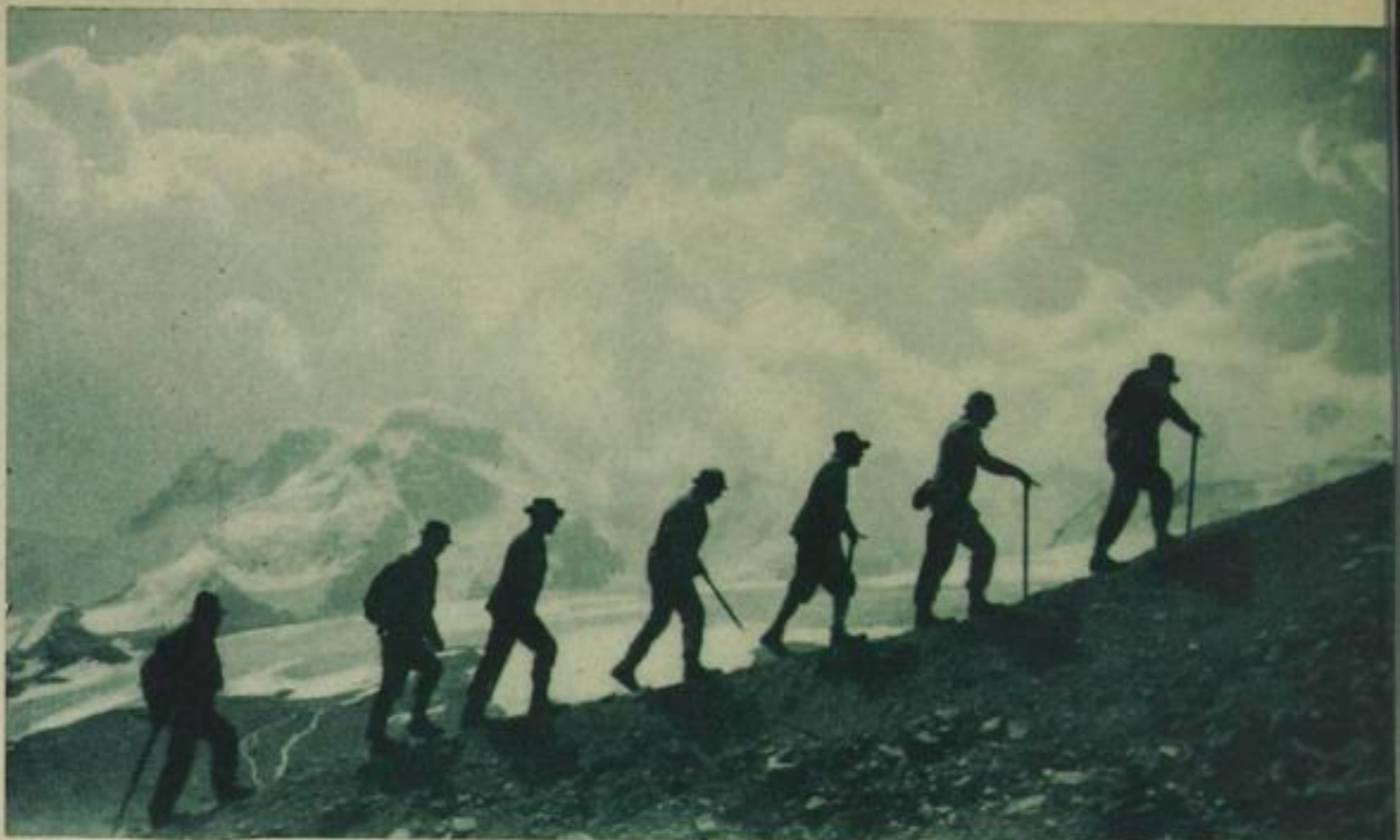
Der Aufstieg zur Matterhornhütte

natürlichen Wegweisern, wie Eisbrüchen, Spalten und steilen Eishängen, gewiesen wird, einfacher zu finden. Wir sind auf 4000 Meter Höhe und spüren schon merklich die dünne Luft. Sie ermüdet sehr stark, und wir müssen uns die letzten 600 Meter richtig etappenweise erkämpfen. „Ihr geht verdammt gut!“ meinen die Führer zu uns, die selbst langsamer