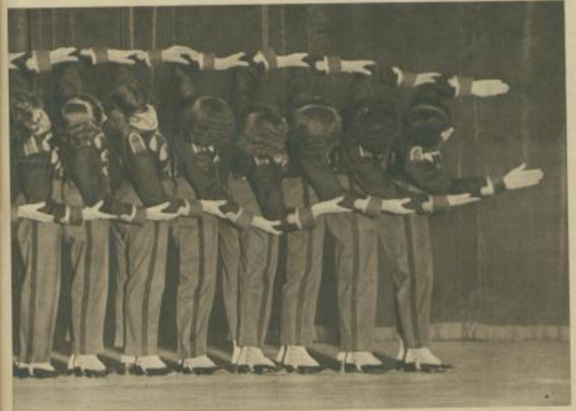
in der Berliner „Scala“; Die Lokomotive

Die tänzerische Nachahmung einer fahrenden Lokomotive wirkt verblüffend. Die Armreihen stellen an Schnelligkeit gewinnt. Das Zischen und Fauchen