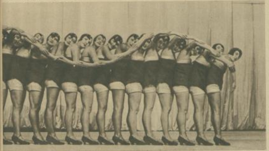
in einer Moskauer Music Hall