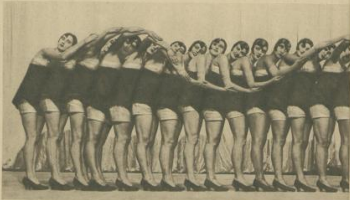
Girlriege beim „Schlangenmarsch.“