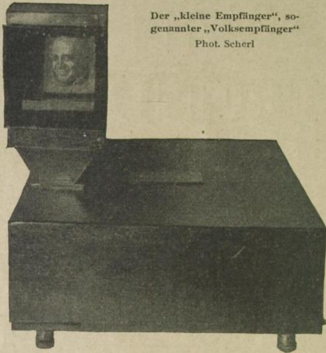
Der „kleine Empfänger“, sogenannter „Volksempfänger“

sichern, daß einen niemand bestehlen kann, und das ist oft nicht leicht.“