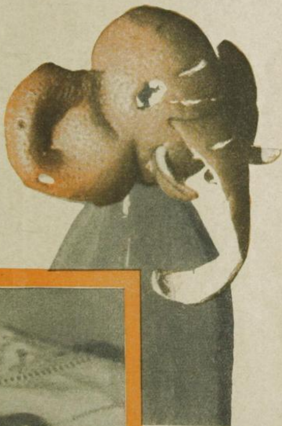
Nuri, der Elefant

A pfelsinen sind nicht nur zum Essen da. Wer eine Apfelsine verzehrt, ohne das kostbare Spielzeugmaterial ihrer Schale zu beachten, ist gar nicht so weit von dem unvorstellbaren Verschwender entfernt, der imstande wäre, eine gute Apfelsine ungegessen fortzuwerfen. Für den, der sie anzupacken versteht, können Apfelsinen witzig, lustig, hinreißend komisch sein, können jede Gesellschaft eine ganze Weile unterhalten,