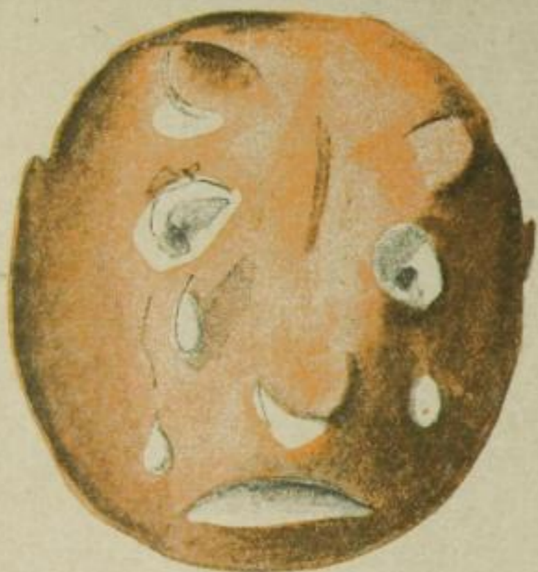
Der weinende Herr

A pfelsinen sind nicht nur zum Essen da. Wer eine Apfelsine verzehrt, ohne das kostbare Spielzeugmaterial ihrer Schale zu beachten, ist gar nicht so weit von dem unvorstellbaren Verschwender entfernt, der imstande wäre, eine gute Apfelsine ungegessen fortzuwerfen. Für den, der sie anzupacken versteht, können Apfelsinen witzig, lustig, hinreißend komisch sein, können jede Gesellschaft eine ganze Weile unterhalten,