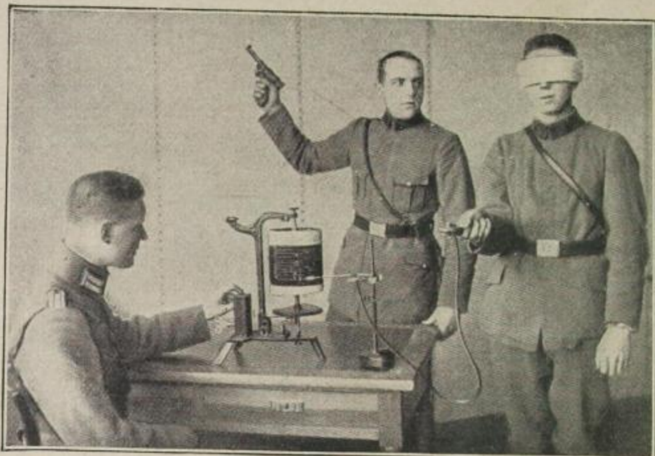
Prüfung der Ruhe und Sicherheit des Verhaltens gegenüber Schreckreizen Die Versuchsperson, der die Augen verbunden sind, hält eine empfindliche Kapsel in der Hand. Beim unvermuteten Abfeuern einer Pistole werden die mehr oder weniger großen Schwankungen beim schreckhaften Zusammenfahren der Versuchsperson durch einen Gummischlauch auf eine Schreibkapsel übertragen und aufgezeichnet

sondern klaren Kopf und besonnen vor- ausschauende Gedanken zu behalten.