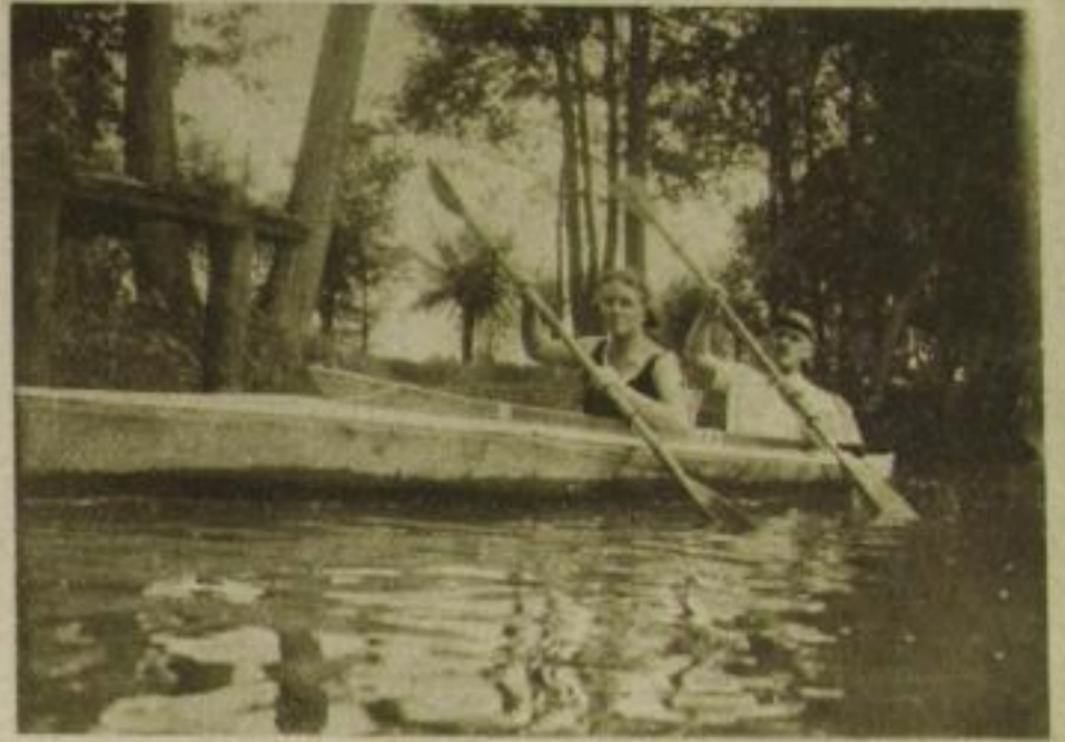
Fahrt im Klepperboot durch den Spreewald

Faltboot-Werke, Rosenheim 20 Größte und modernste Faltbootwerft der Welt.