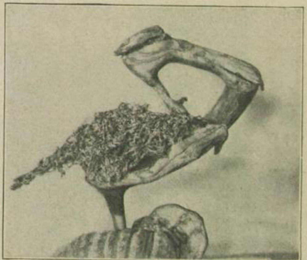
Wurzelplastik von Paul Neumann, Karlsberg: Schuhschnabel. Gefunden bei Marienbad

suchte, zeigte sich mir der Tierfreund noch von einer anderen, originellen Seite: als Wurzel- und Knorrensammler! Überall sah man die grotesksten Wurzelfiguren herumstehen und -hängen, Tiergesichter und Teufelsfratzen, Waldmänner und Alraungebilde. „Alles so gefunden! Ich habe nur vielleicht mit dem Messer einen kleinen Schnitt, mit dem Pinsel einen Farbtupfen nachgeholfen, da eine Glasperle als Auge eingesetzt, hier