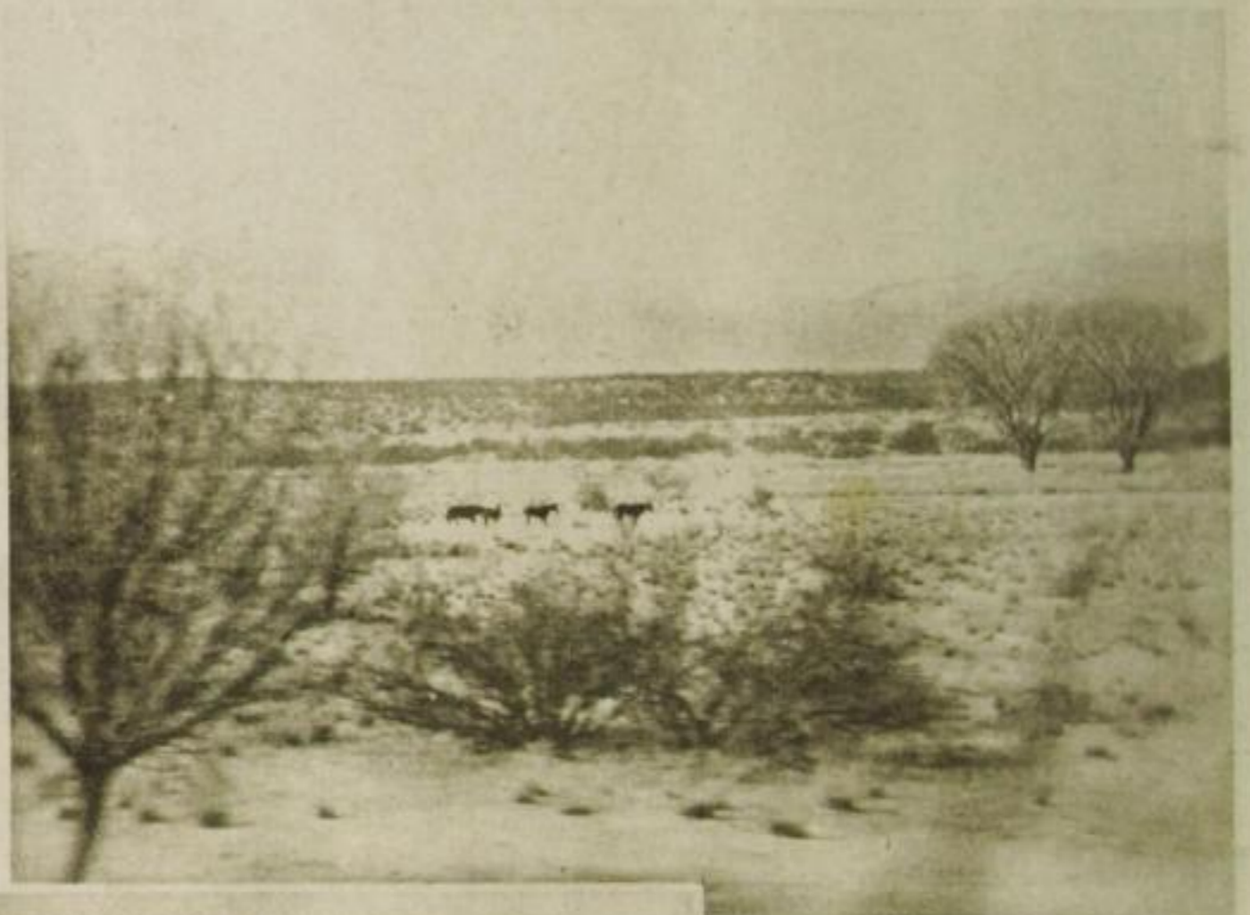
Auf dem Wege nach Hollywood fährt man tagelang an solch tristen Steppen vorüber

In den letzten Jahren habe ich zweimal Gelegenheit gehabt, in jener amerikanischen Stadt lange zu leben, deren Name so verlockend, aufwühlend für die Phantasie des Europäers und namentlich des europäischen Mädchens klingt, jenem durch menschliche Energie einem dünnen Erdboden abgerungenen Fleckchen Paradies, in dem der Großteil des amerikanischen Film-