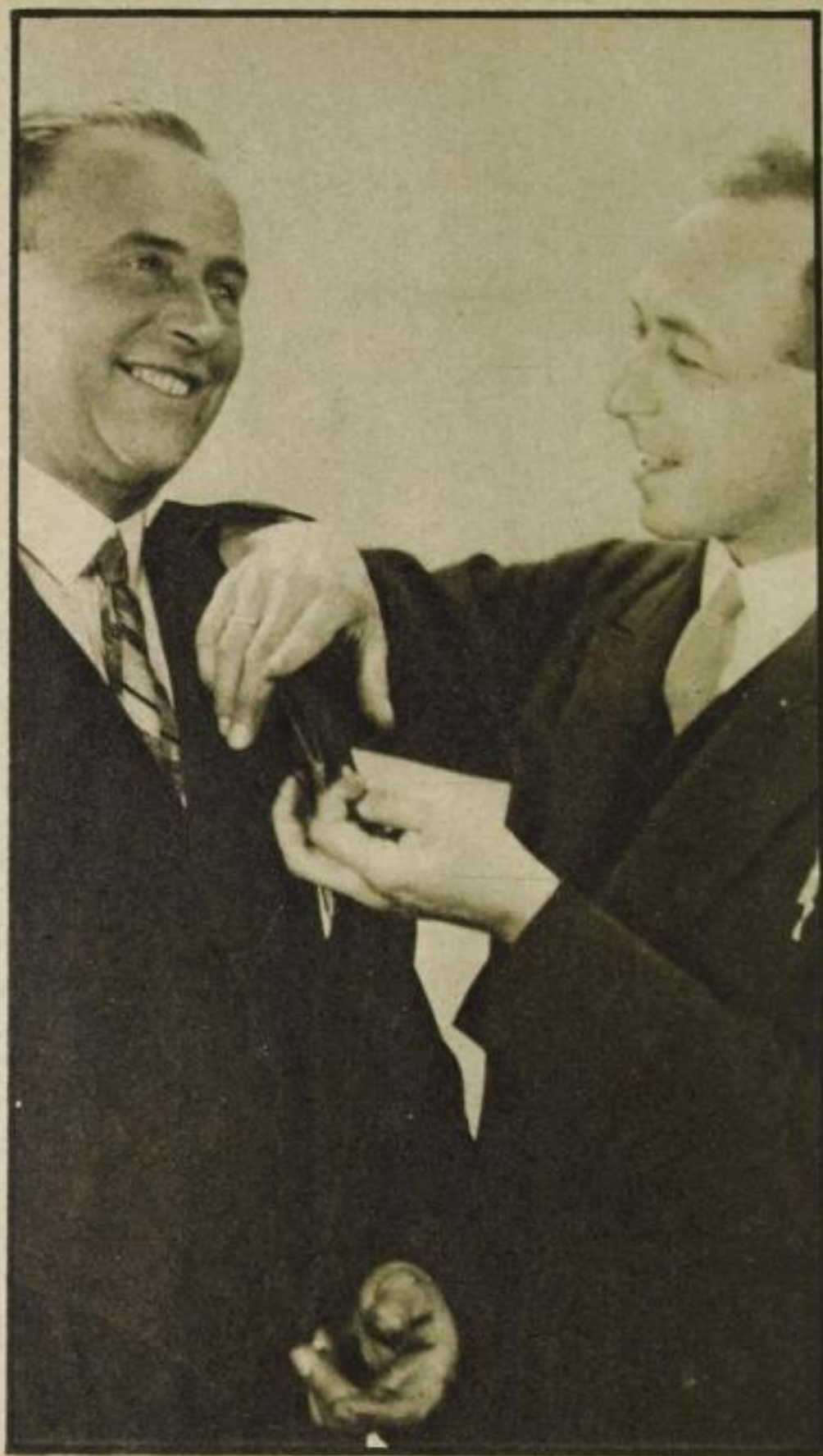
„Wie geht's sonst? Zu Hause alles wohl?“ Trick der lebenswürdigen Anbiederung (Die Linke arbeitet, die Rechte maskiert)

E in eleganter schlanker Mann, von gepflegtem Äußeren, steht vor mir und lächelt mir entgegen: „Ich weiß, was Sie sich denken,“ meint er, „Sie glauben, ich werde mit Ihnen machen, was ich allabendlich vor Tausenden im ‚Wintergarten‘ mache . . . Sie irren. Hier lesen Sie!“