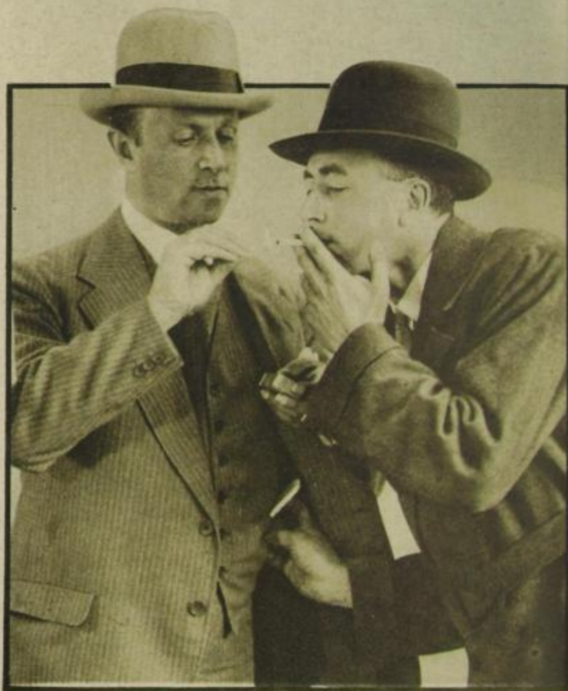
„Darfidum Feuer bitten?“ Ein ebenso landläufiger wie sicherer Trick der Anfänger unter den Taschendieben

Mit Sonderaufnahmen für „Sherls Magazin“