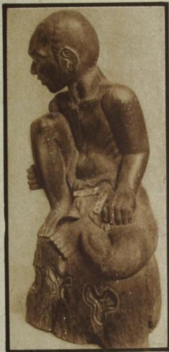
Balinesische Holzplastik: Sitzender Bauer mit Lendenschurz

Untergang des Abendlandes? . . . Vielleicht darf man es begreifen als ein Aufgehen Europas in die Gesamtheit der Erdoberfläche. Die Neuzeit rückte Kontinente einander nahe wie früher Provinzen eines Landes; der ganze Erdkreis tat sich auf in unerhörter, verwirrender Fremdheit. Das gilt auch für die geistesgeschichtlichen Bereiche, auch da brandete ein Chaos uns entgegen. Heute, wo wir Sinn und Zusammenhang all der fremden, andersgearteten Kulturen tastend zu verstehen beginnen, erkennen wir, daß das Abendland gelöst wurde aus der jahrtausendlangen Isoliertheit seines bisherigen Weltbildes; daß es sich anschickt, mit schöpferischer Selbsthingabe den ganzen Erdkreis er-