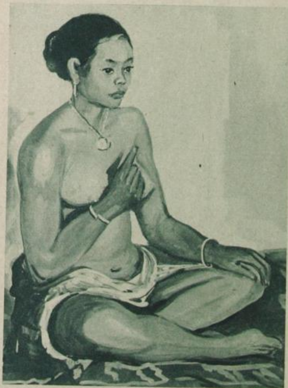
Javanin. Gemälde von Ernst Vollbehr