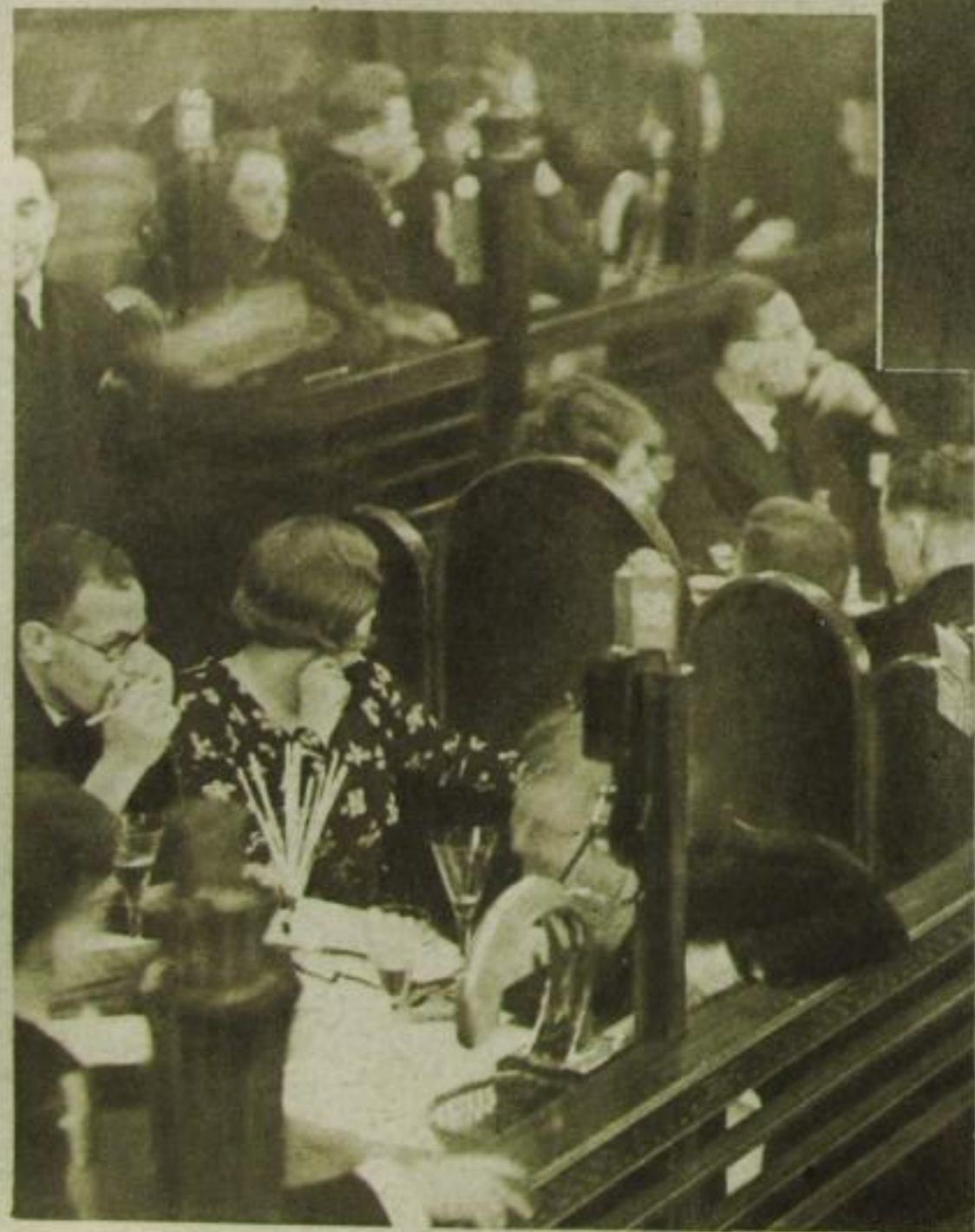
Hier flirtet man per Rohrpost und Tisditelephon

Schleppen aus Georgette und Marocain! Na, und ganz schneide is et in der Blumenstraße. Da können Sie mit Rohrpost schießen und sich bei flirrend buntem Licht telephonisch mit dem Ziel ihrer Wünsche unterhalten. Da können Sie so richtig schwoofen, vom Walzer bis zum Quick-Step.