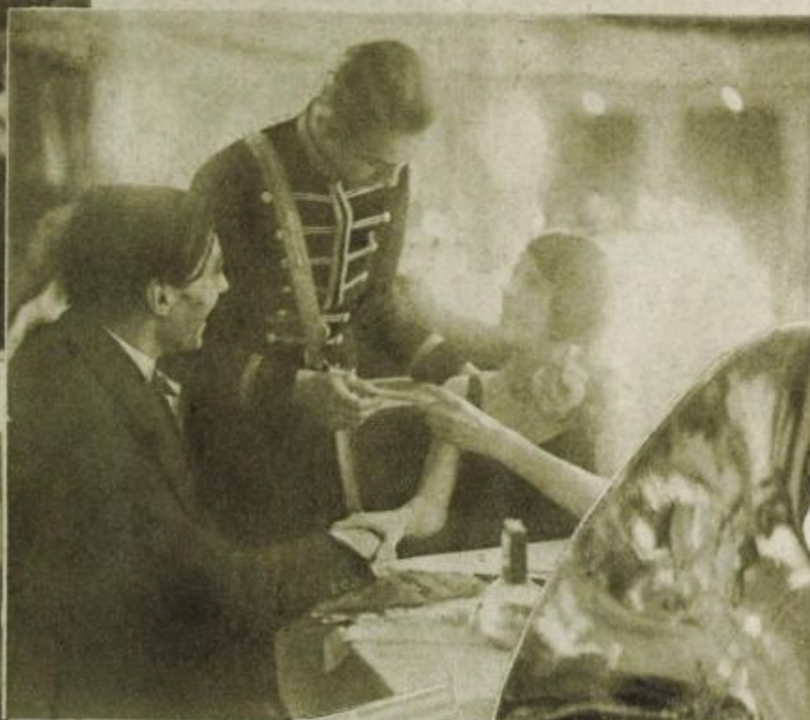
Oben: Der Boy als postillon d'amour (Presse-Photo)