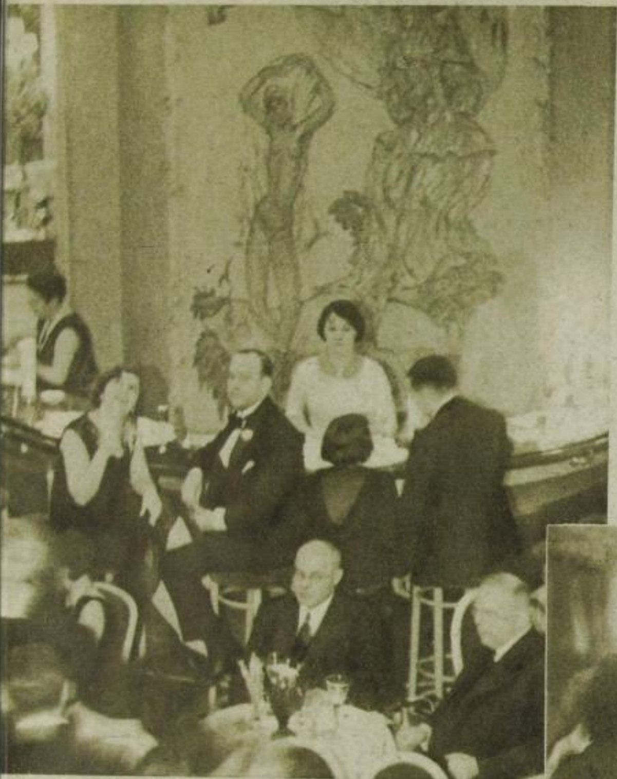
An der Cocktail-Bar