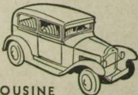
4 PS LIMOUSINE

Noch nie zuvor haben die deutschen Käufer Gelegenheit gehabt, ein wirkliches Automobil für weniger als RM 2000.- zu kaufen... Neue Arbeitsmethoden machen es weiteren Tausenden, die bisher nie in der Lage waren, sich ein Auto zu leisten, jetzt möglich... Trotz niedrigerer Preise bietet Ihnen der verbesserte Opel bessere Qualität, gesichert durch Verwendung besten Materials, durch Präzisionsarbeit, sorgfältige Inspektion und ständige Überwachung seitens der Versuchsabteilung.