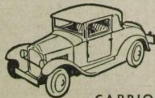
4 PS CABRIOLET

Verbesserter Motor, verbesserte Kühlung, verbesserter Vergaser, verbesserte Bremsen, verbesserte Steuerung... und außerdem noch schönere Karosserien bieten Ihnen Schönheit, Bequemlichkeit, Sicherheit, Dauerhaftigkeit, Kraft, Geschwindigkeit, Sparsamkeit und Preiswürdigkeit... Sie müssen unbedingt diesen Wagen sehen. Gehen Sie heute noch zum nächsten Opelhändler. Er wird Ihnen auch Auskunft über die erleichterten Zahlungsbedingungen geben.