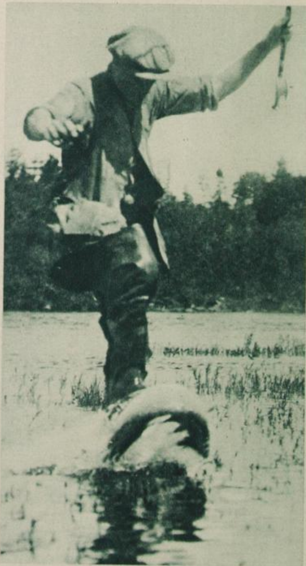
Letzter Kampf des Königs der Angelfische

Oben: Springender Lachs auf der Wanderung in Neufundland