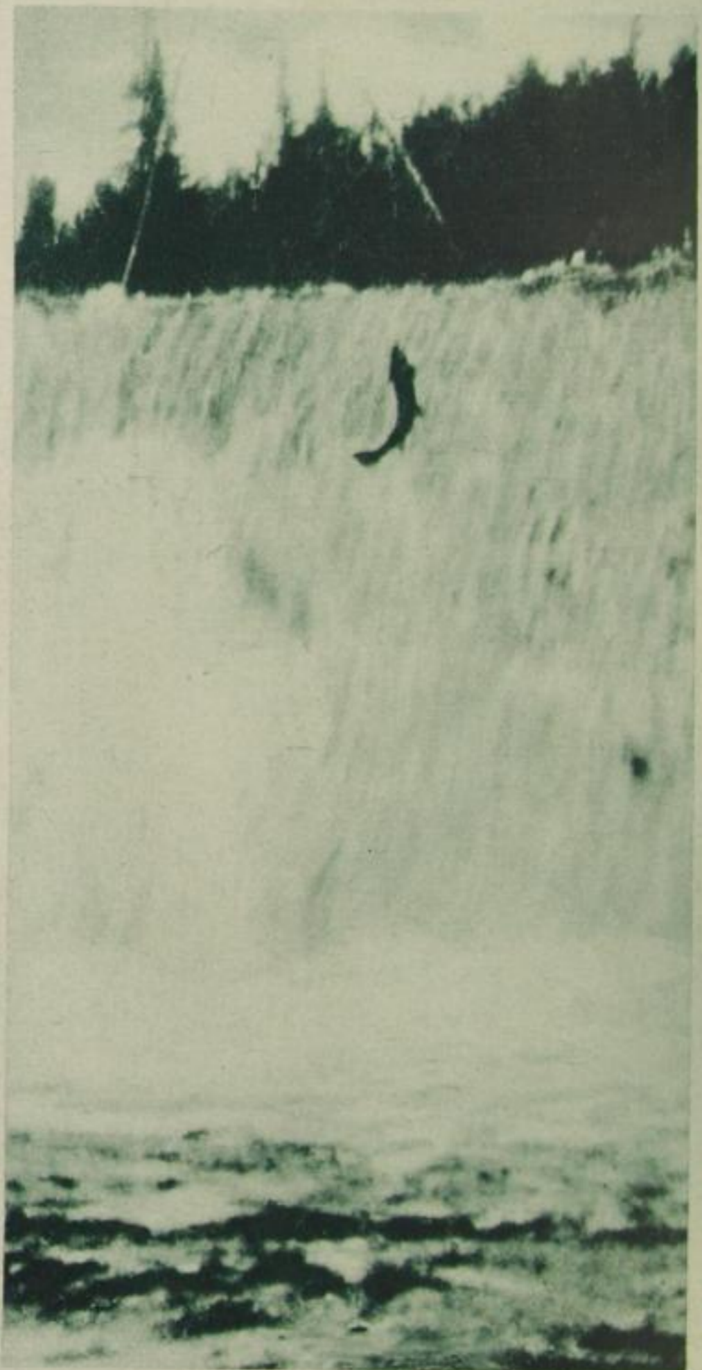
Stromauf beim Sprung auf einen 4 m hohen Fall