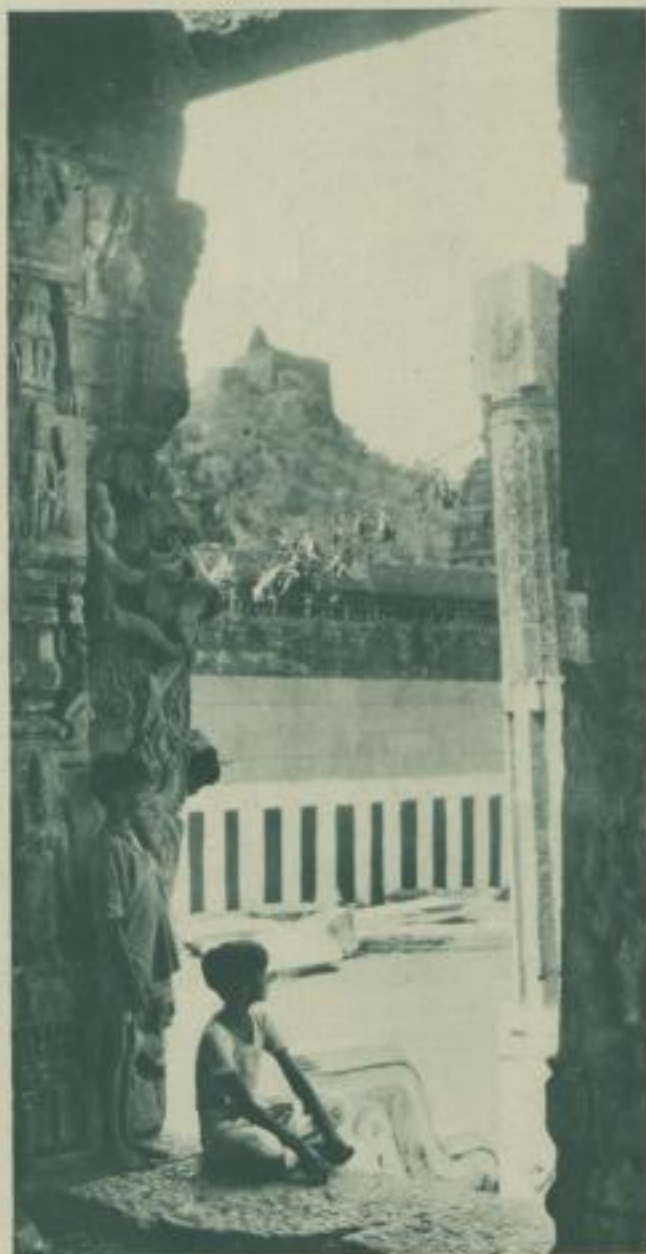
Der burgähnliche Tempel der Zaubervögel, vom Haupttempel aus gesehen