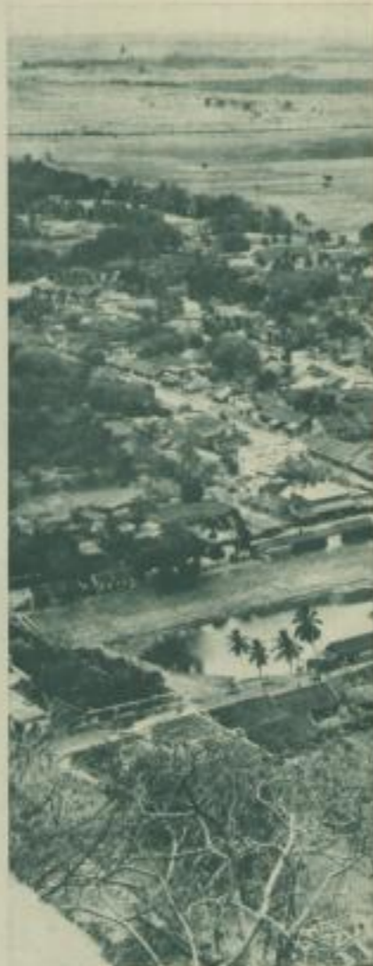
Blick vom Tempelberg

In grauer Vorzeit, so berichtet die Sage der Puvanes, lebten in Südindien zwei Weise, die alle Geheimnisse und Kräfte der