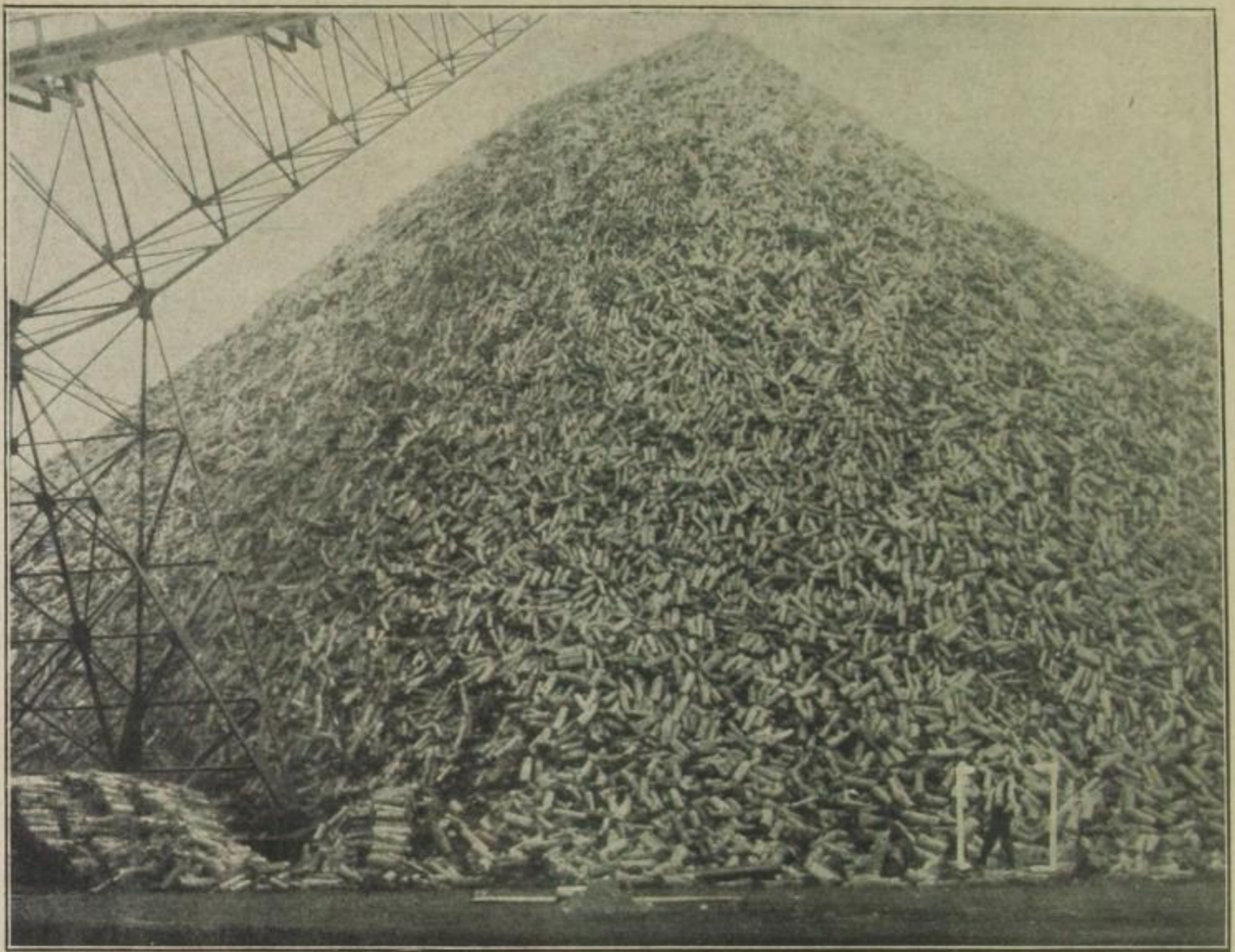
Pyramide aus Schnittholz zur Zellstoff- bereitung. Der [weißeingeklammerte] Mann gibt den Maßstab für die Höhe des Holzberges