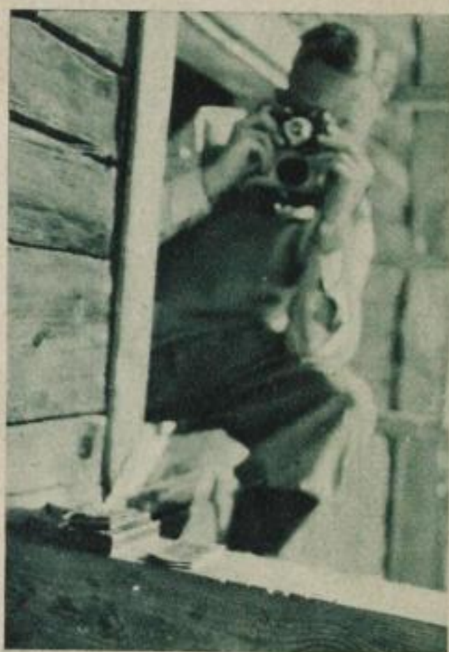
Nebenerwerb als Pressephotograph ist oft nicht ganz einfach