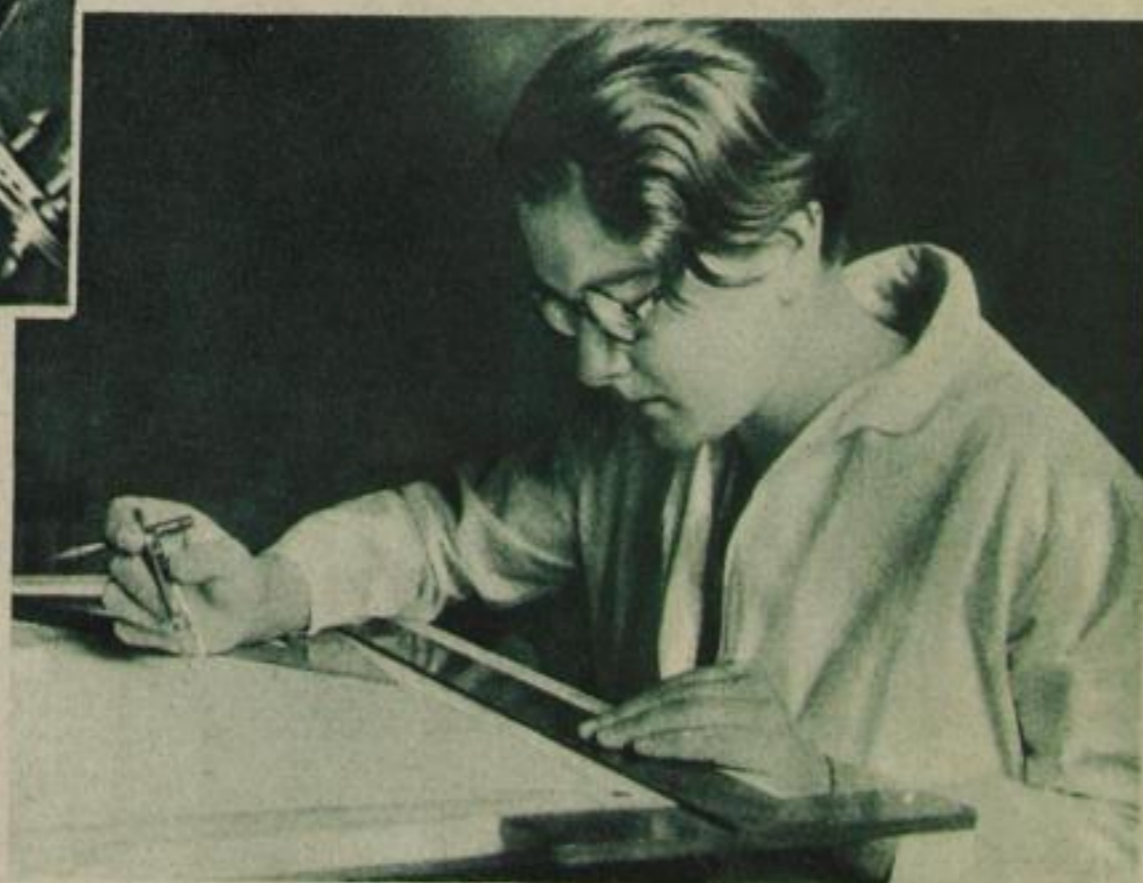
Fräulein stud. arch. verdient sich ihren Unterhalt durch künstlerische Reklameentwürfe

für 25 Pf. die Stunde arbeiten, weil sich sonst bestimmt später einer findet, der es für 20 Pf. tut.