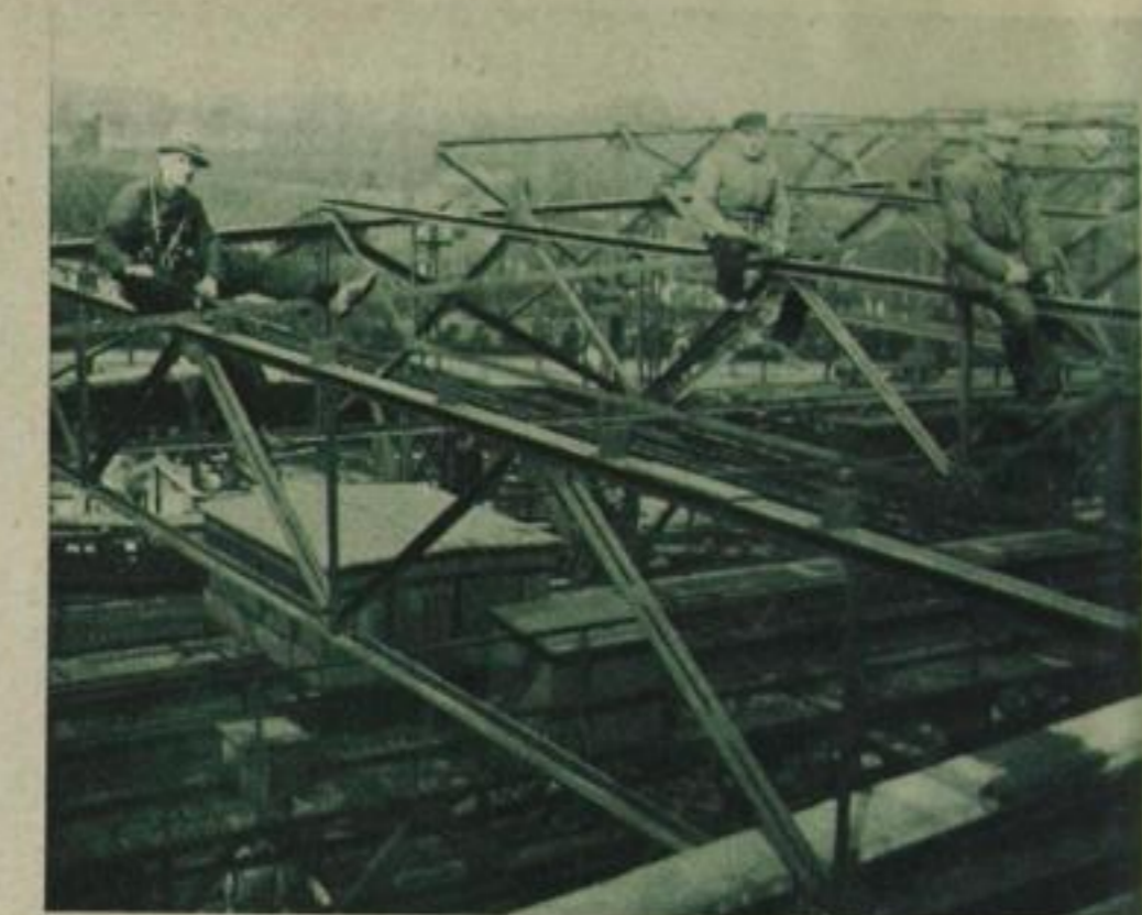
Ein Werkstudent als Hochbauarbeiter

★ Aber die Notwendigkeit, Geld zu verdienen, bringt es mit sich, daß Arbeit um jeden Preis angenommen wird. Darum ist Studentenarbeit auch so billig. Manche müssen