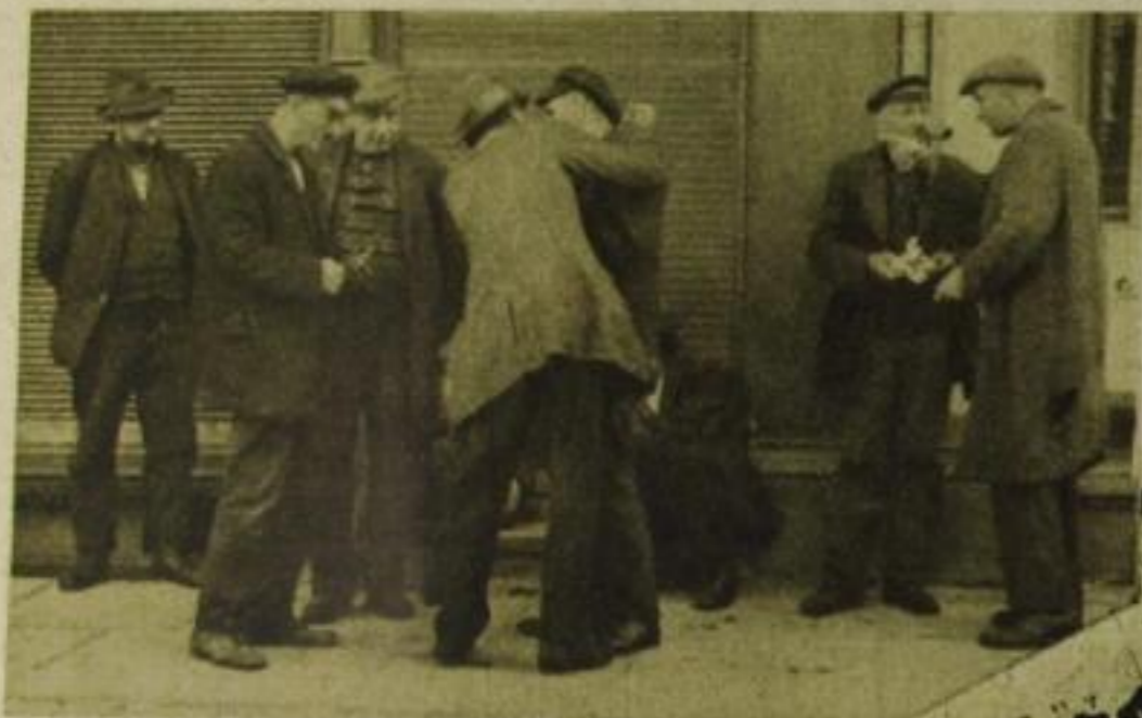
Bei der Morgenpfeife werden die letzten „Neuigkeiten“ ausgetauscht