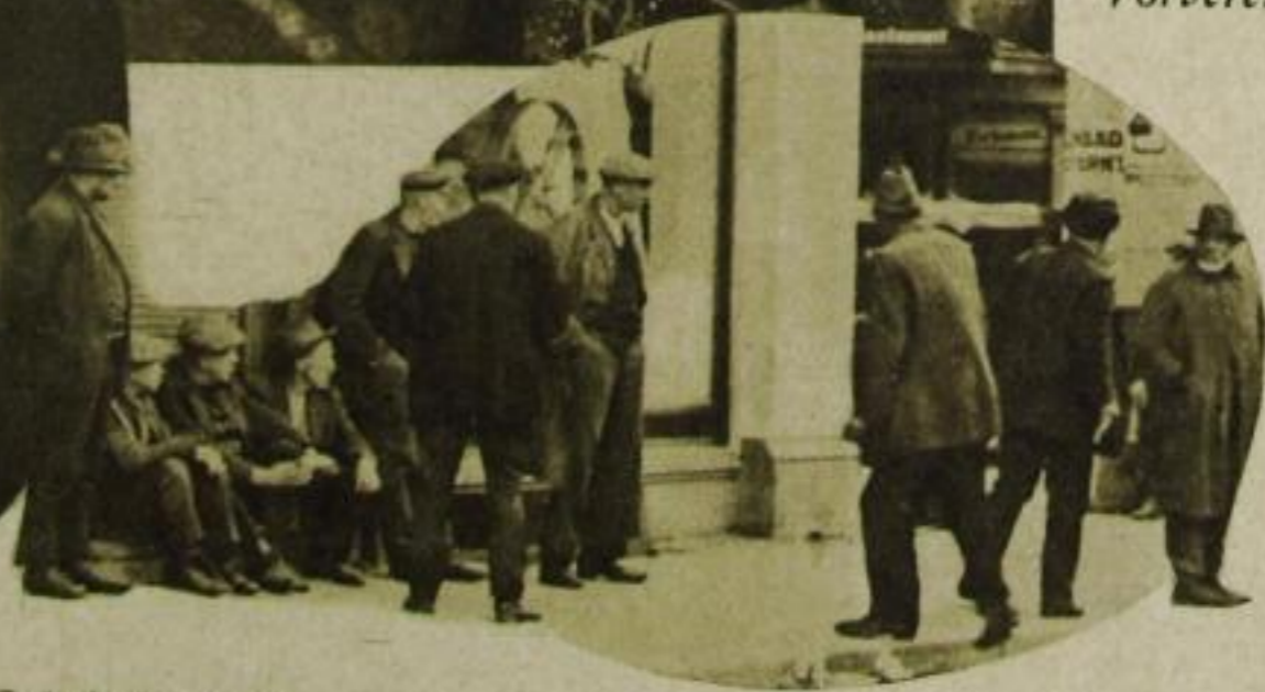
Etwas ist in Vorbereitung