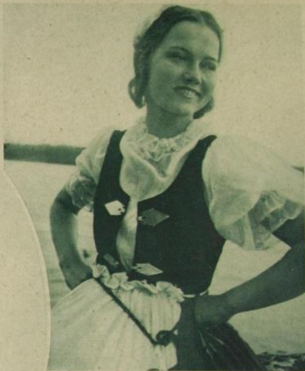
Junge Finnländerinnen, links in der Tracht von Orimattila, rechts in oesterbaltischer Tracht