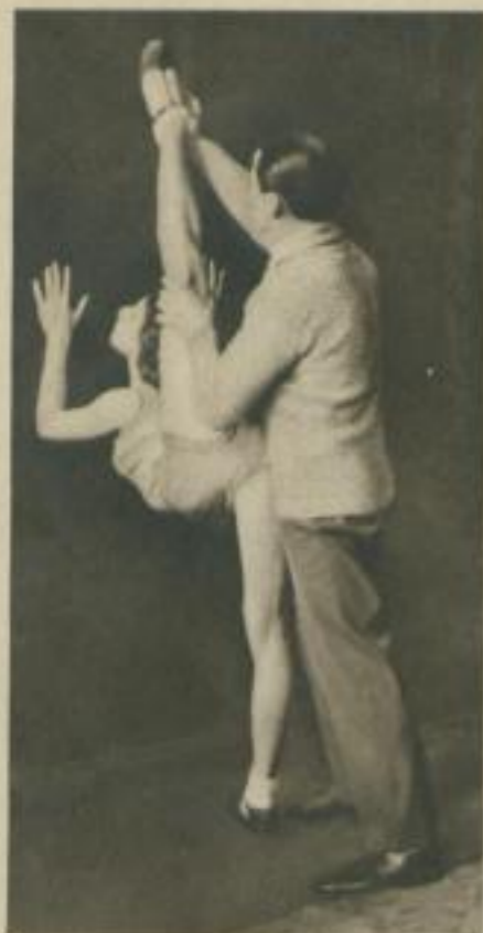
Spagat im Stand, schwierig und schmerzhaft