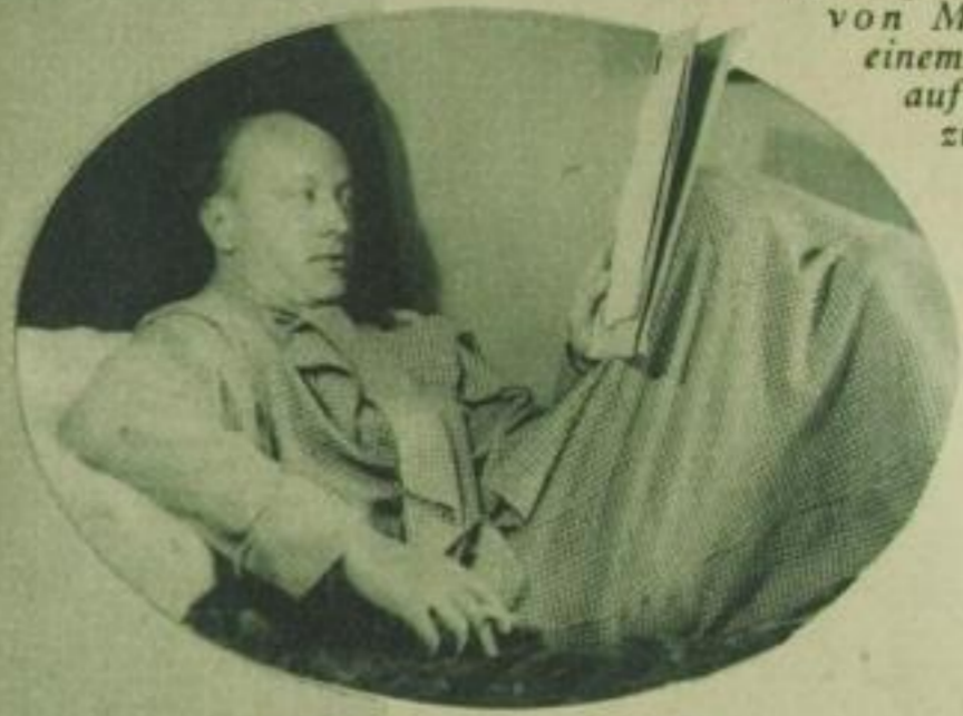
„Wer wagt ein Tänzchen mit mir?“ (Der Schauspieler Hubert von Meyerinck auf einem Kostümfest und auf seiner Couch zu Hause)