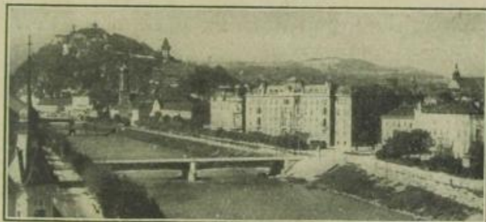
Die Hauptstadt von Steiermark, Graz an der Mur, 150 000 Einwohner