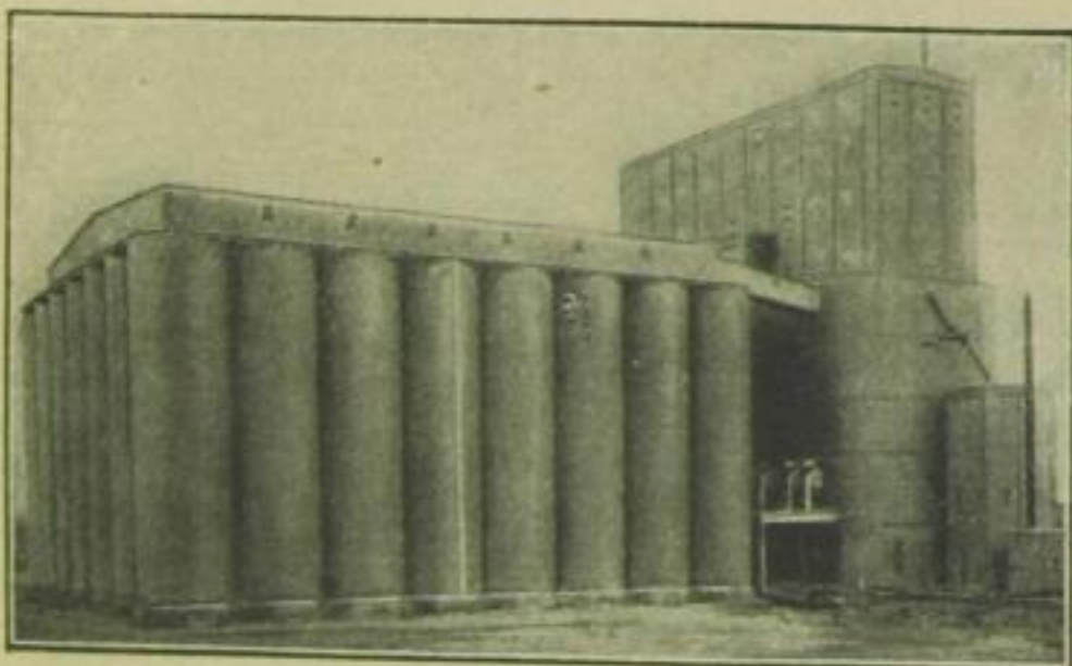
Silo (Getreidespeicher). Es gibt auch Silos für Kohle, Kies, Erz u. a.