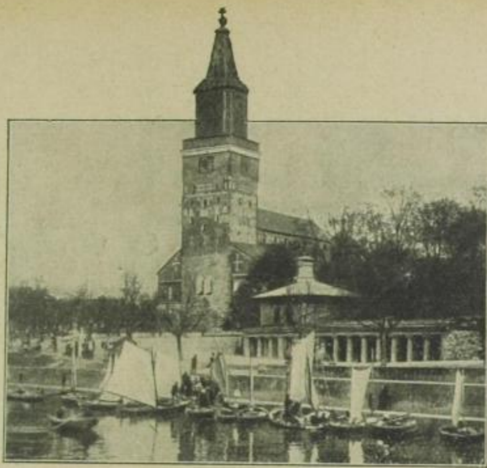
Abo, Stadt in Finnland am Bottnischen Golf, 60 000 Einwohner