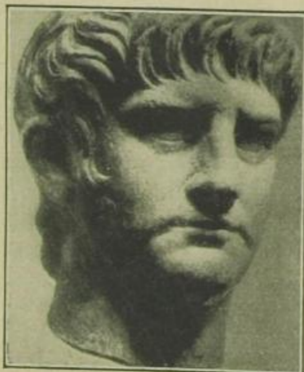
Nero, römischer Kaiser, * 37, † 68 n. Chr.