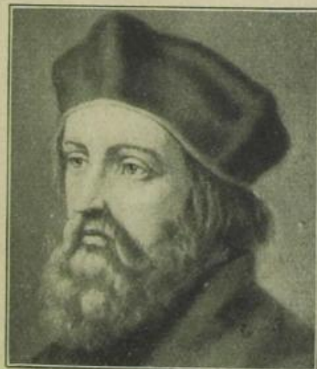
Johann Hus, böhmischer Reformator, * 1369, † 1415 (auf dem Konzil zu Konstanz verbrannt)