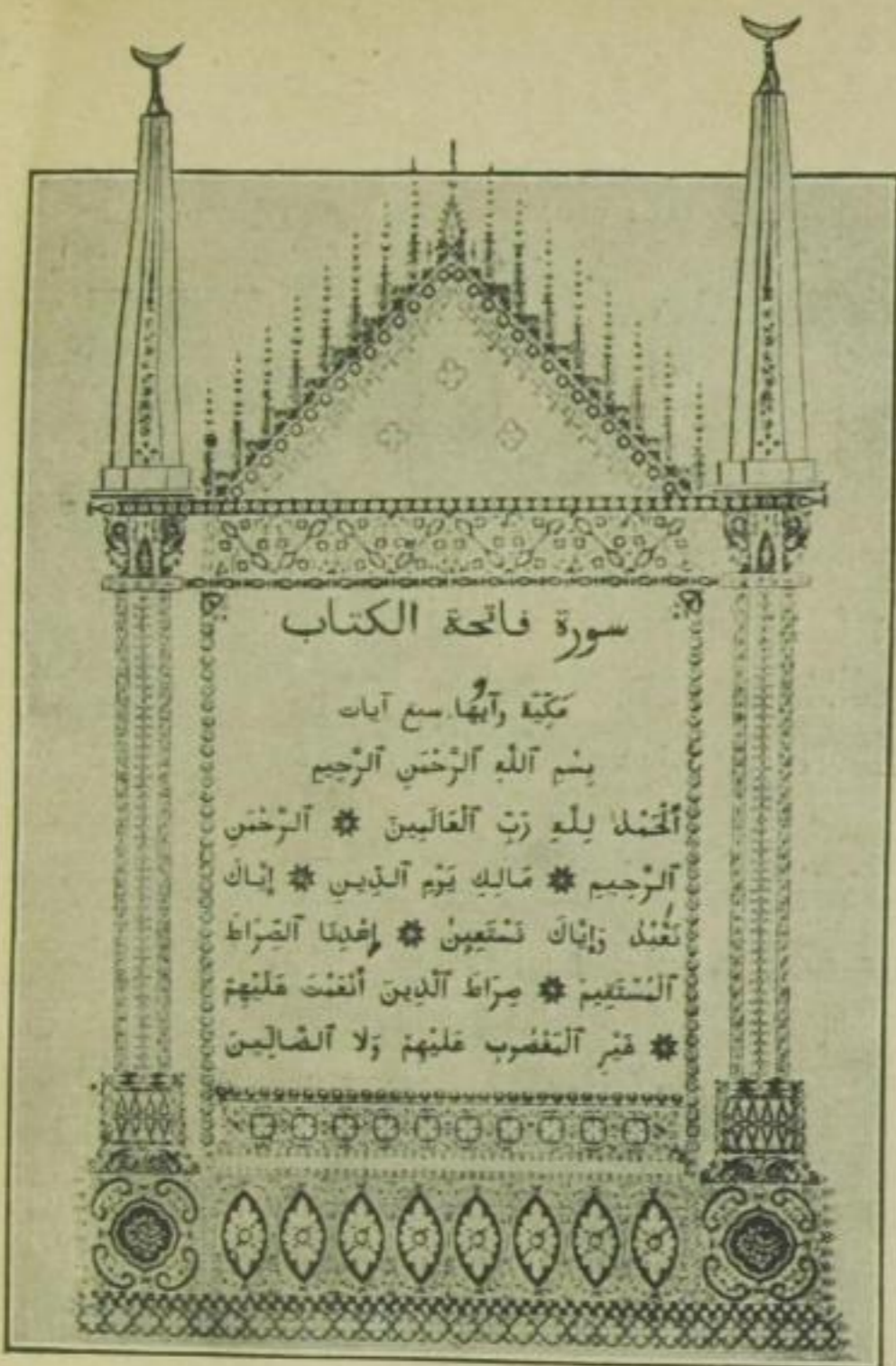
Die erste der 114 Suren (Kapitel) des Korans